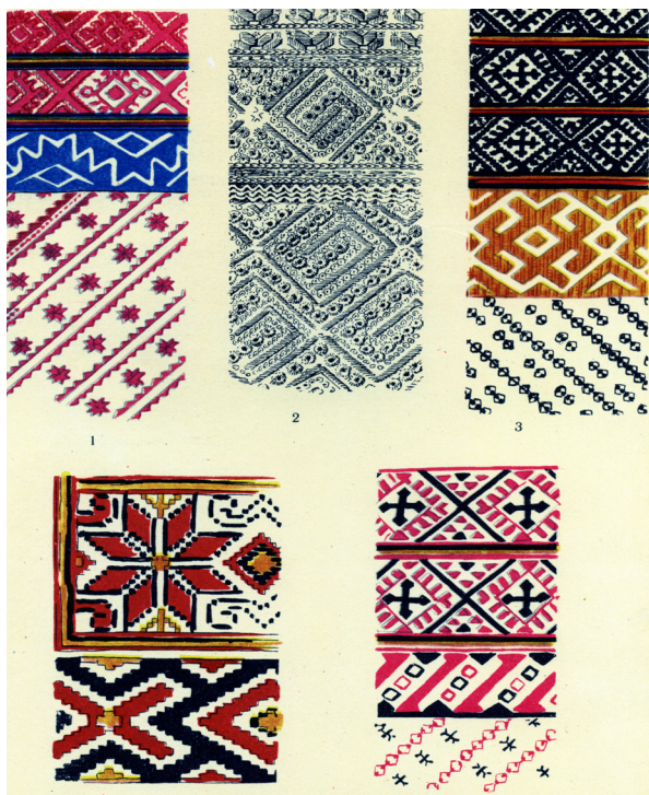
Вишивки Снятинщини. Покуття, кінець XIX ст.