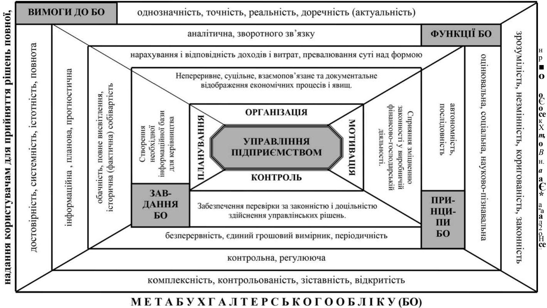
Рис. 2. Бухгалтерський облік у системі управління підприємством