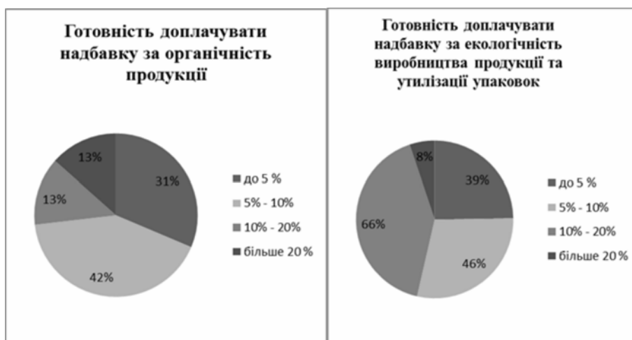
Рис. 2. Готовність населення доплачувати різної величини надбавку за органічність та екологічність виробництва та утилізації упаковок сільськогосподарської продукції

Наступний рисунок 2. графічно відображає готовність населення Івано-Франківської області доплачувати надбавку до ціни продукції за органічність та екологічність виробництва та утилізації упаковок в залежності від величини надбавки.