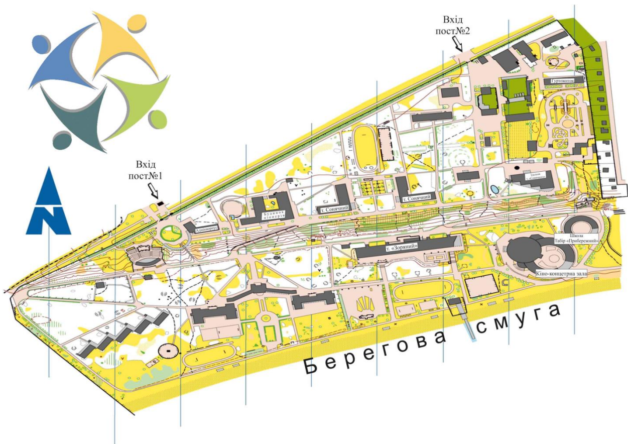
Карта ДП «Український дитячий центр «Молода гвардія»

Цікаво, що матеріали для будівництва табору привозили з різних міст України та з-за кордону: мрамур – з Уралу, рожевий туф з Казахстану, граніт – з кар’єрів Житомирщини. У корпусі табору знаходяться житлові кімнати, розраховані на 4 та 10 осіб (це найбільший за чисельністю дітей-рекреантів табір, він одночасно може прийняти близько 500 осіб), їдальня, медпункт і зала авіації та космонавтики.