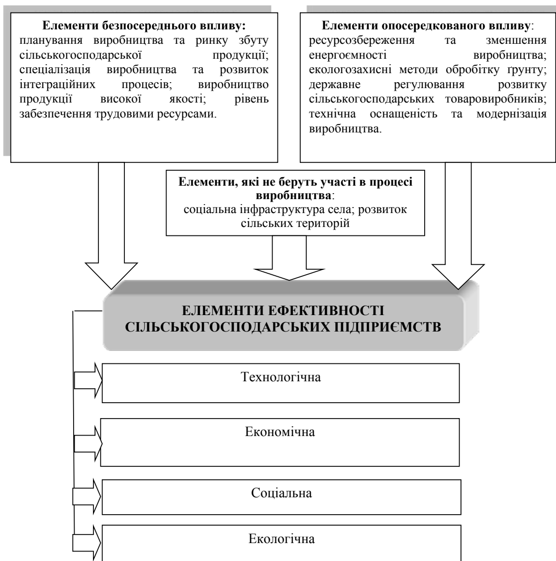
Рис. 1. Концептуальні елементи ефективності розвитку сільськогосподарських підприємств

Плануючи виробництво нових продуктів, доцільними є вивчення ринків збуту і потреб споживача, розроблення бізнес-плану, а також правильний розподіл своїх фінансових ресурсів. У процесі планування відбувається розмежування принципів та методів планування на ті, які відповідають наміченим цілям розвитку сільськогосподарських підприємств і забезпечують їх збалансований розвиток, і на ті, які мають лише короткострокові інтереси та не розкривають майбутніх завдань. Тобто без планування виробництва та ринків збуту сільськогосподарської продукції досягти економіч-