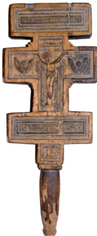
Іл. 2. Хрест ручний. 1849 р. Гуцульщина. Церква Воздвиження Чесного Хреста (м. Надвірна).