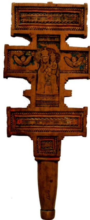
Іл. 3. Хрест ручний. Кін. XIX ст. Гуцульщина. Івано-Франківський краснознавчий музей.

У XIX — на початку XX ст. процесійні хрести на Гуцульщині дуже часто прикрашалися популярними тоді техніками «сухої» різьби й інкрустації. Прикладом такого знака є хрест початку XX ст. із церкви св. Василя з м. Косів [9, с. 117]. Це чотирикінцевий хрест із трипелюстковими завершеннями кінців. У підніжжі його форму доповнює півмісяць, а на середхресті — чотири промені. Тло знака декороване різьбленими й інкрустованими орнаментальними мотивами.