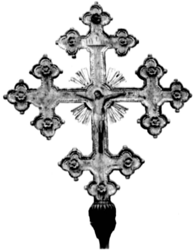
Іл. 5. Хрест процесійний. Поч. XIX ст. С. Репецьке, Лемківщина.

Розміщені на середхресті, вони чітко виділяються на фоні інших, дрібніших плоскорельєфних елементів, що заповнюють усе тло хреста. У медальйонах на чотирьох кінцях знака зображені ангели, святий Микола, Ісус Христос та ін. Оздоблення середньої частини рамен утворюють різні для двох виробів композиції із хрестів.