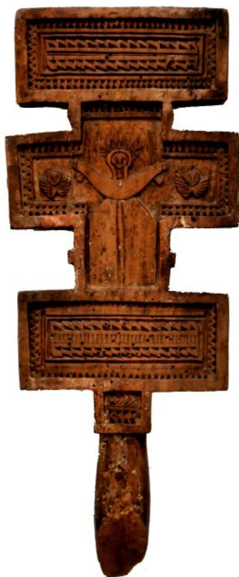
Іл. 1. Хрест ручний. XIX ст. Гуцульщина. Івано-Франківський краснознавчий музей. Світлина П. Кузенка