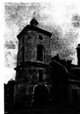
Рис. 5. Дзвіниця монастиря. Фото 2008 р.

Споруди келій та гімназії симетрично примикають до храму, що мають стриманий характер архітектурного вирішення; декором для них служать на всю стіну дзеркало та прості обрамлення періодично розташованих вікон. Завершуються фасади тонкопрофільованим карнизом із двосхилим дахом.