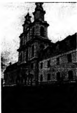
Рис. 4. Головний фасад монастиря. Фото 2008 р.

Розкриття внутрішнього простору храму спрямоване на вівтар і організовано під впливом західноєвропейських зразків XVIII ст. без іконостаса, з 5 вівтарями, проповідальницею і 6 сповідальницями. Нава і трансепт перекриті півциркульними склепіннями з розпалубками на попружних арках. Стіни нави розділені високими арочними нішами із сюжетними розписами XVIII ст., оформлені спареними пілястрами з ліпними капітелями, стилізованими під композитний ордер, і антаблементом із карнизом досить високого виносу. Над середохрестям здіймається великий ліхтарик із маківкою. Такий самий, але менший за розмірами ліхтарик завершує фронтон східного фасаду. Прототипом Хрестовоздвиженської церкви могли послужити храми в Білорусі та Литві школи “віленського бароко”, заснованої архіт. Яном Кшиштофом Гляубітцом. Такий тип василіанських монастирських храмів широко поширений у Білорусі. Цей тип храмів епохи бароко не привів до зміни планувальної структури кам'яного храму, але сам силует ускладнився. Головний західний фасад даного типу храмів увінчується щипцем та двома стрункими вежами. Плани і фасади набувають криволінійних обрисів, що надає споруді пластичності. Дві вежі на західному фасаді характерні для храмів Західної Європи (капела “Сорок святих” в Німеччині, монастир в Банце арх. Йоганна Динценгофера).