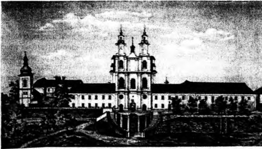
Монастир і школа оо. василіан у Бучачі. Літографія К. Качинського, 1865. Львівський історичний музей