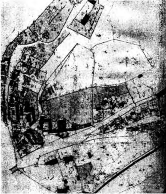
Рис. 1. Фрагмент кадастрової карти з монастирем (ЦДІА України у Львові. – Ф. 186, оп. 1, од. зб. 5724)

щень та дзвіниці. Весь ансамбль монастирських споруд розпланований компактно, на порівняно невеликій видовженій ділянці, в центрі якої розміщено храм, до якого симетрично прилягають школа й споруди келій із господарськими приміщеннями та дзвіницею ламаної конфігурації, які утворюють два двори, що з'єднуються між собою арочним проходом у I ярусі (рис. 2, 4). Причому внутрішній двір замкнутий зі сходу підпірною стінкою.