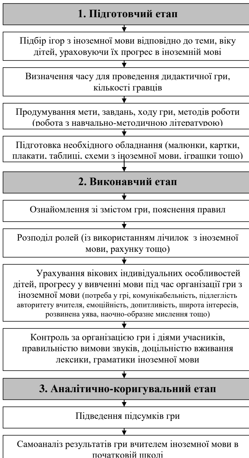
Рис. 2. Етапи організації дидактичних ігор для вивчення іноземної мови в початковій школі

1. Підготовчий етап передбачає визначення вчителем іноземної мови