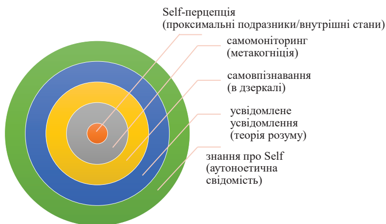
Рис. 2. Компоненти самосвідомості

– самомоніторинг (англ. self-monitoring) задіює процеси пам'яті, передбачає здатність стежити за нашим минулим і сьогоденням та передбачати поведінку в майбутньому і досвід;