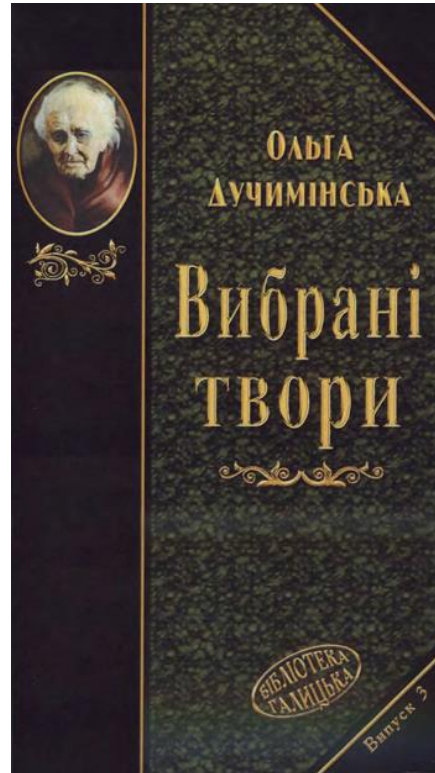
Рис. 2.3. Збірник творів [10]