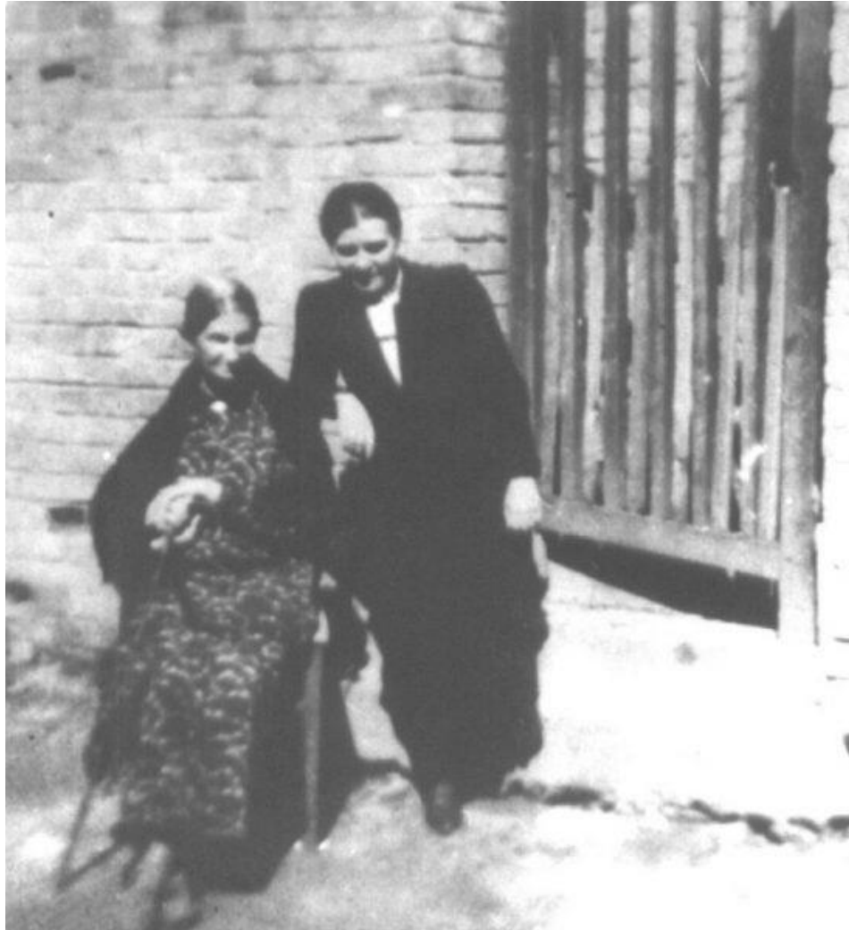
Рис. 3.1. Ольга Кобилянська і Ольга Дучимінська в Чернівцях, 1936 рік [5]