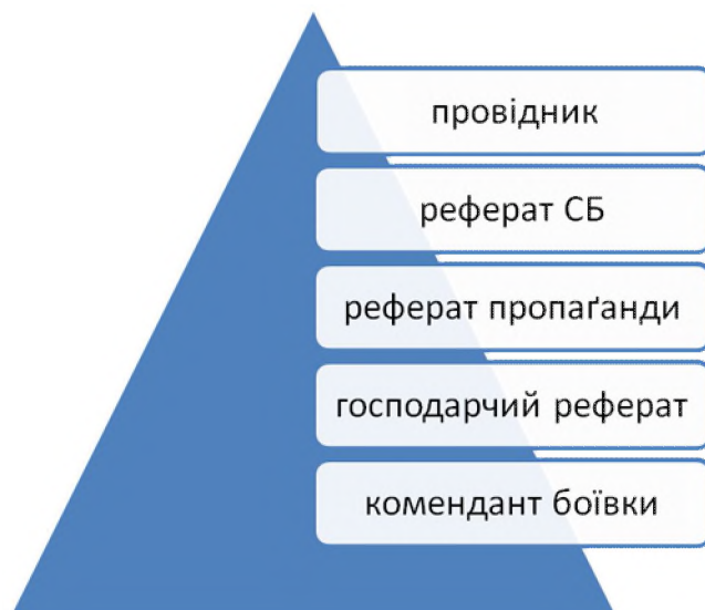
Організаційна структура проводу III району надрайону “Левада”