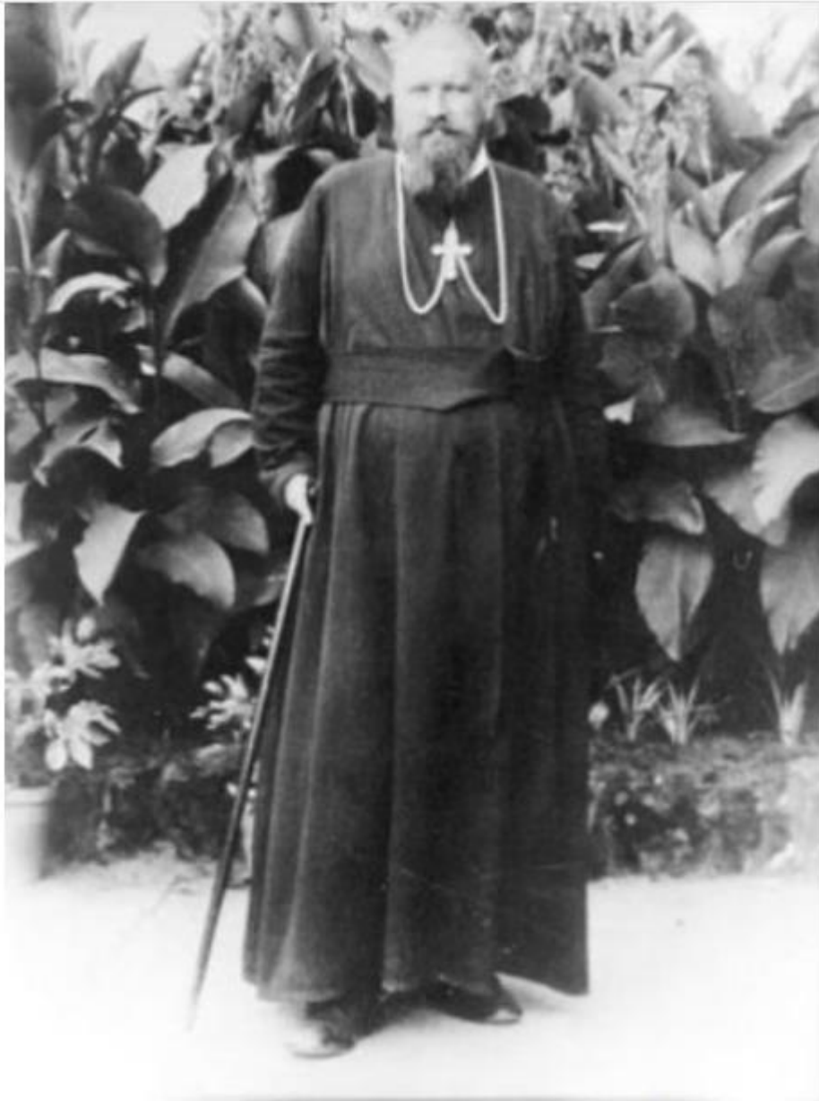
Митрополит Андрей (Канада, 1910 р.)