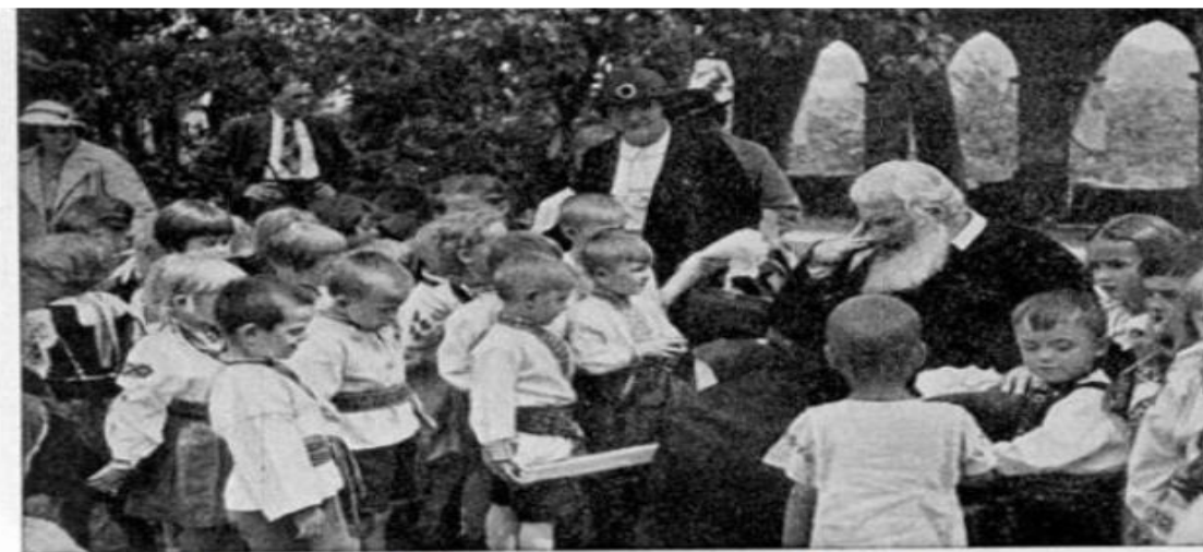
Митрополит Андрей серед дітей (Львів, 1933 р.)