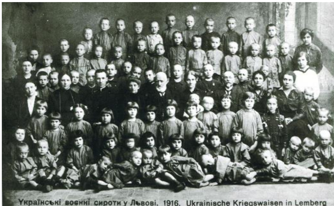
Українські військові сироти у Львові. 1916. Ukrainische Kriegswaisen in Lemberg