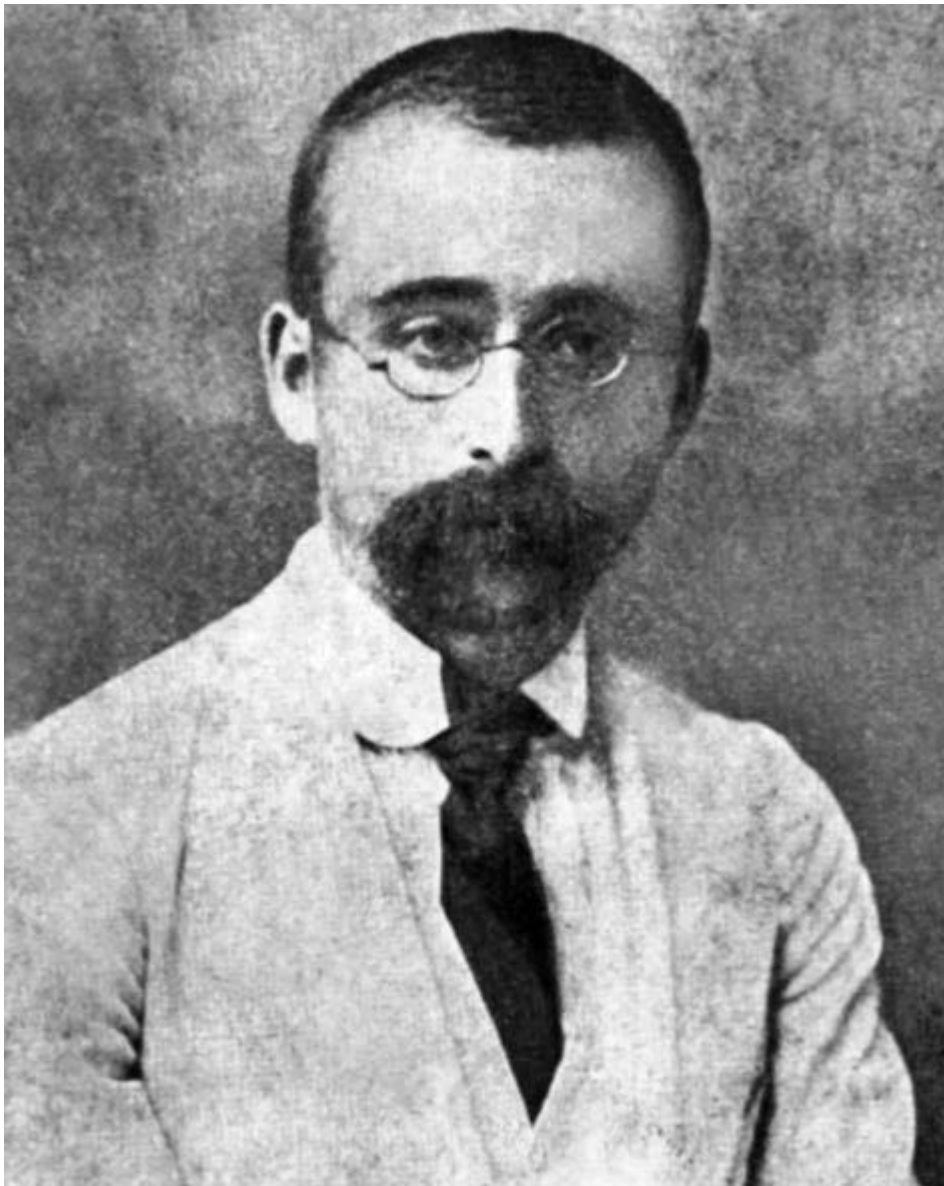
Ковалéвський Микóла Миколáйович міністр земельних справ в уряді В.Винниченка