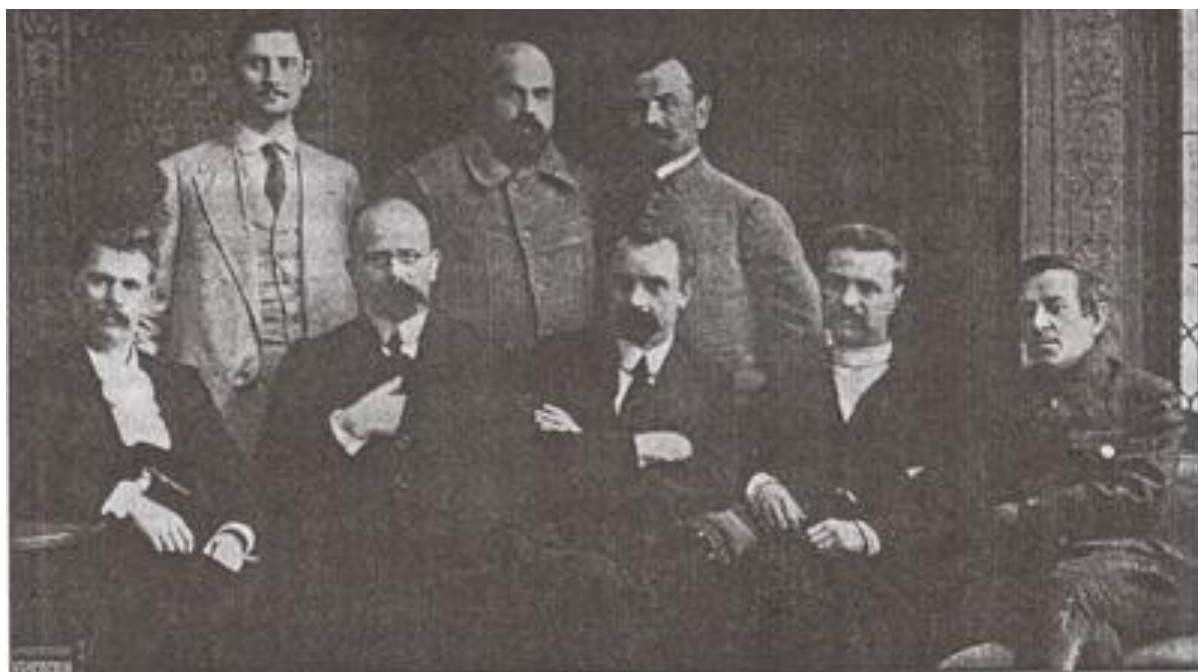
Перший Генеральний Секретаріат Української Центральної Ради. 1917 р. Сидять справа наліво: Симон Петлюра, О. Єфремов, В. Винниченко, Х. Барановський, І. Стеценко. Стоять: Б. Мартос, М. Стасюк, П. Христюк