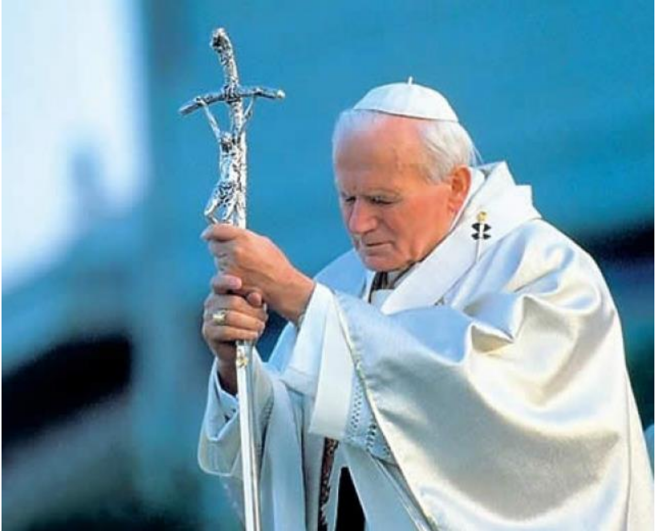
ПАПА РИМСЬКИЙ ІВАН ПАВЛО ІІ