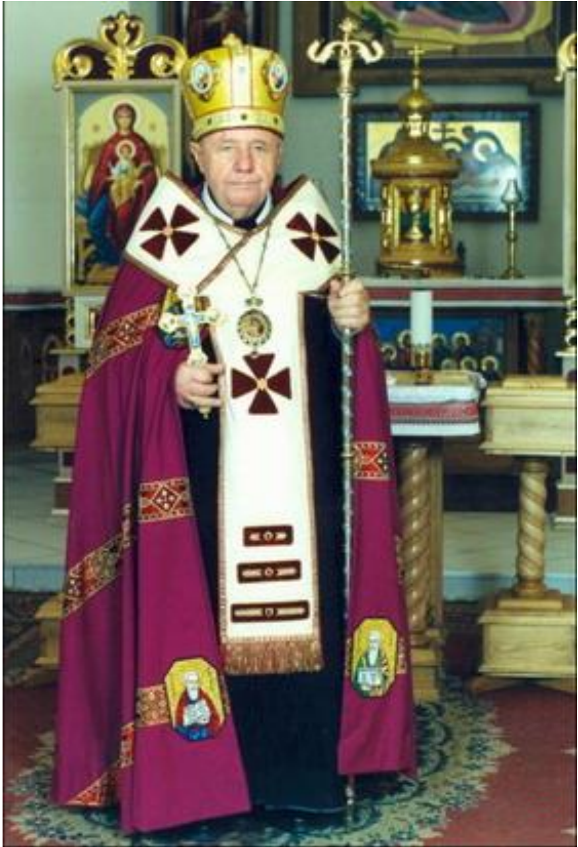
ЄПИСКОП КИР СОФРОН МУДРИЙ