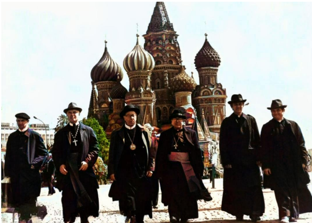
Делегація у Москві 1989 р.- у поході за права УГКЦ.