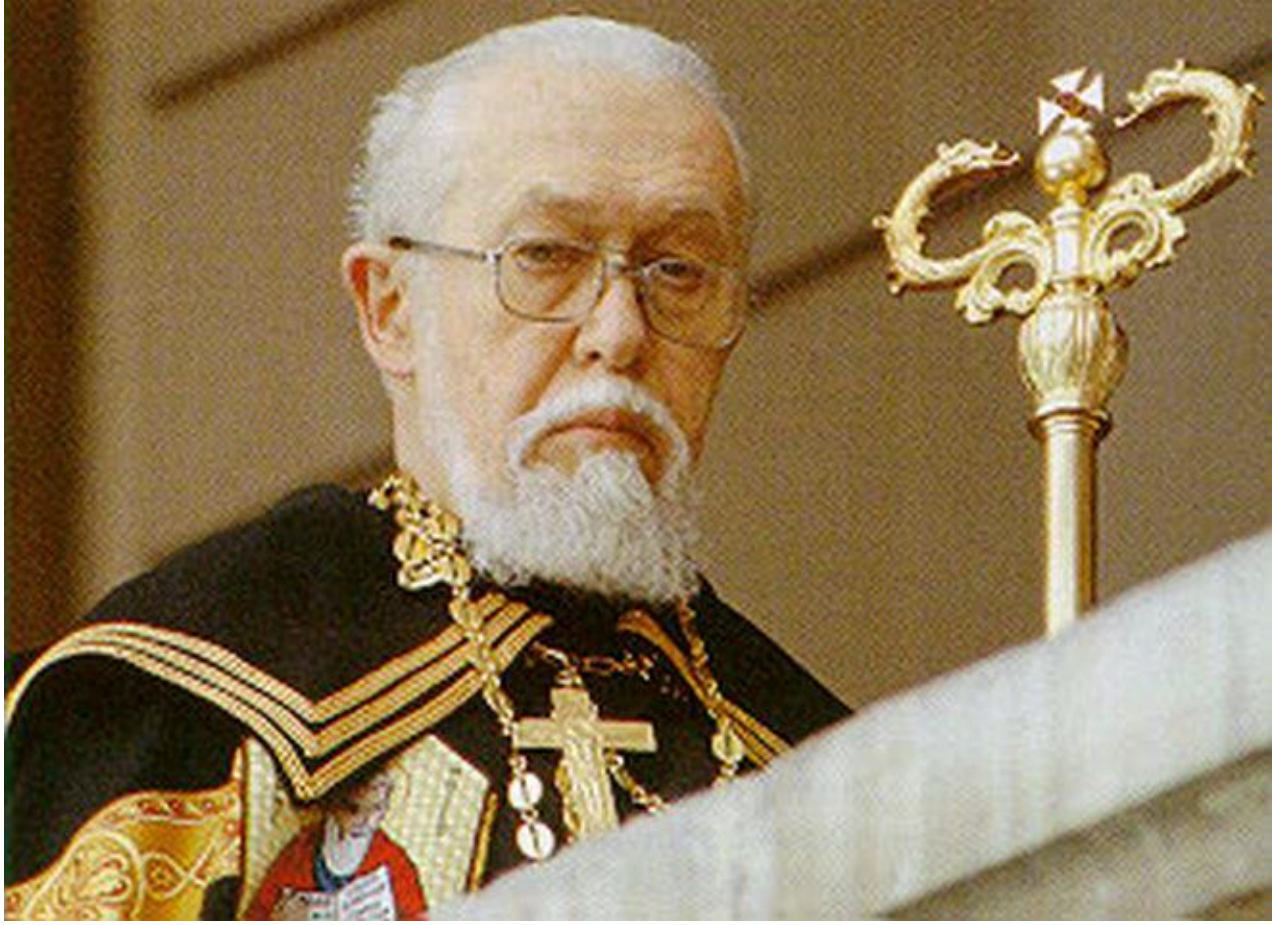
КАРДИНАЛ ІВАН-МИРОСЛАВ ЛЮБАЧІВСЬКИЙ