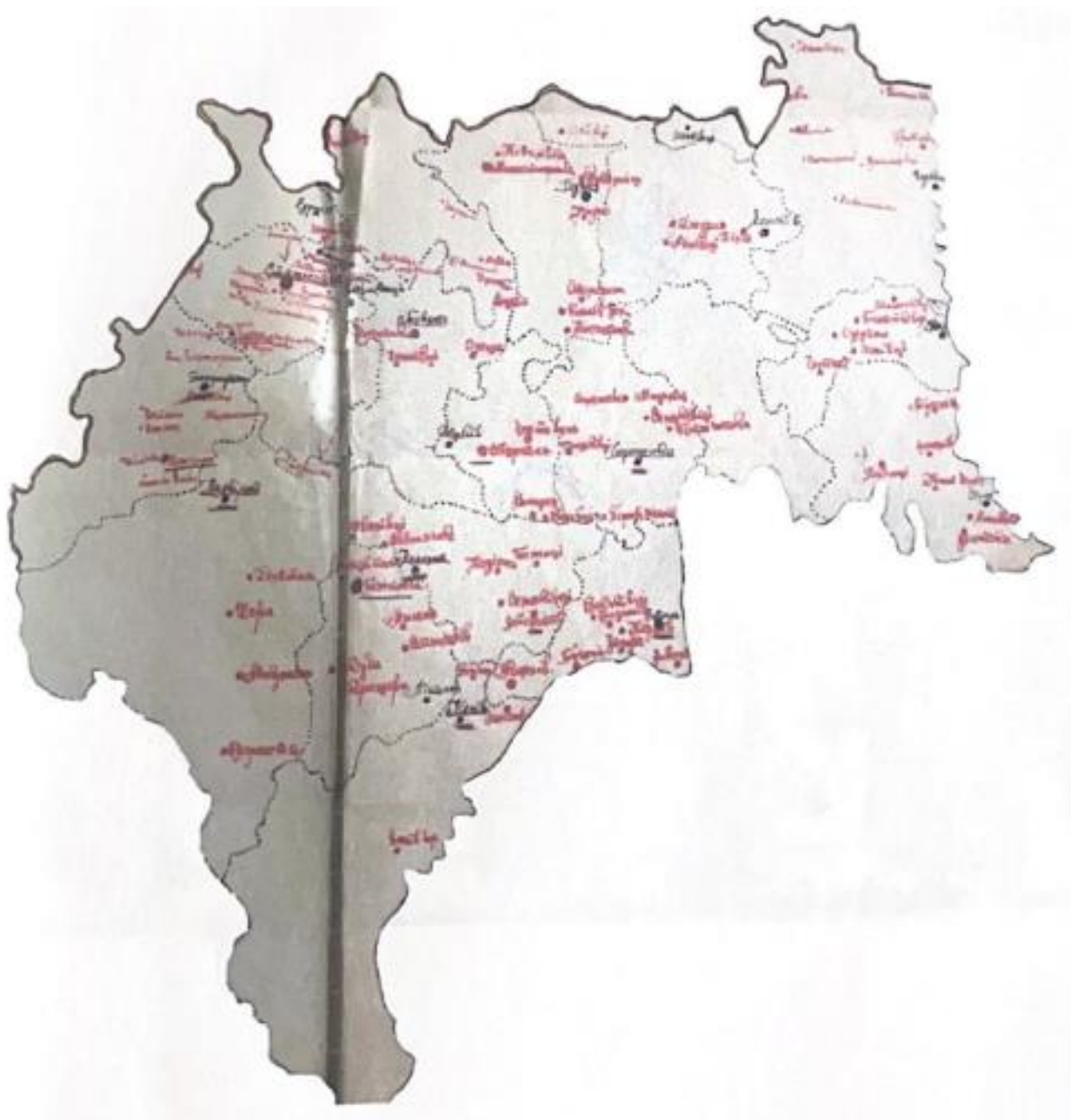
Карта-схема Станіславівської єпархії на 15 листопада 1942 р. Держархів Івано-Франківської обл. Ф. 389. Оп. 2. Матеріали Уповноваженого Ради в справах православної церкви при Раді Міністрів ССРСР по Станіславській області 1944-1962 рр. Спр. 1. 1 арк.