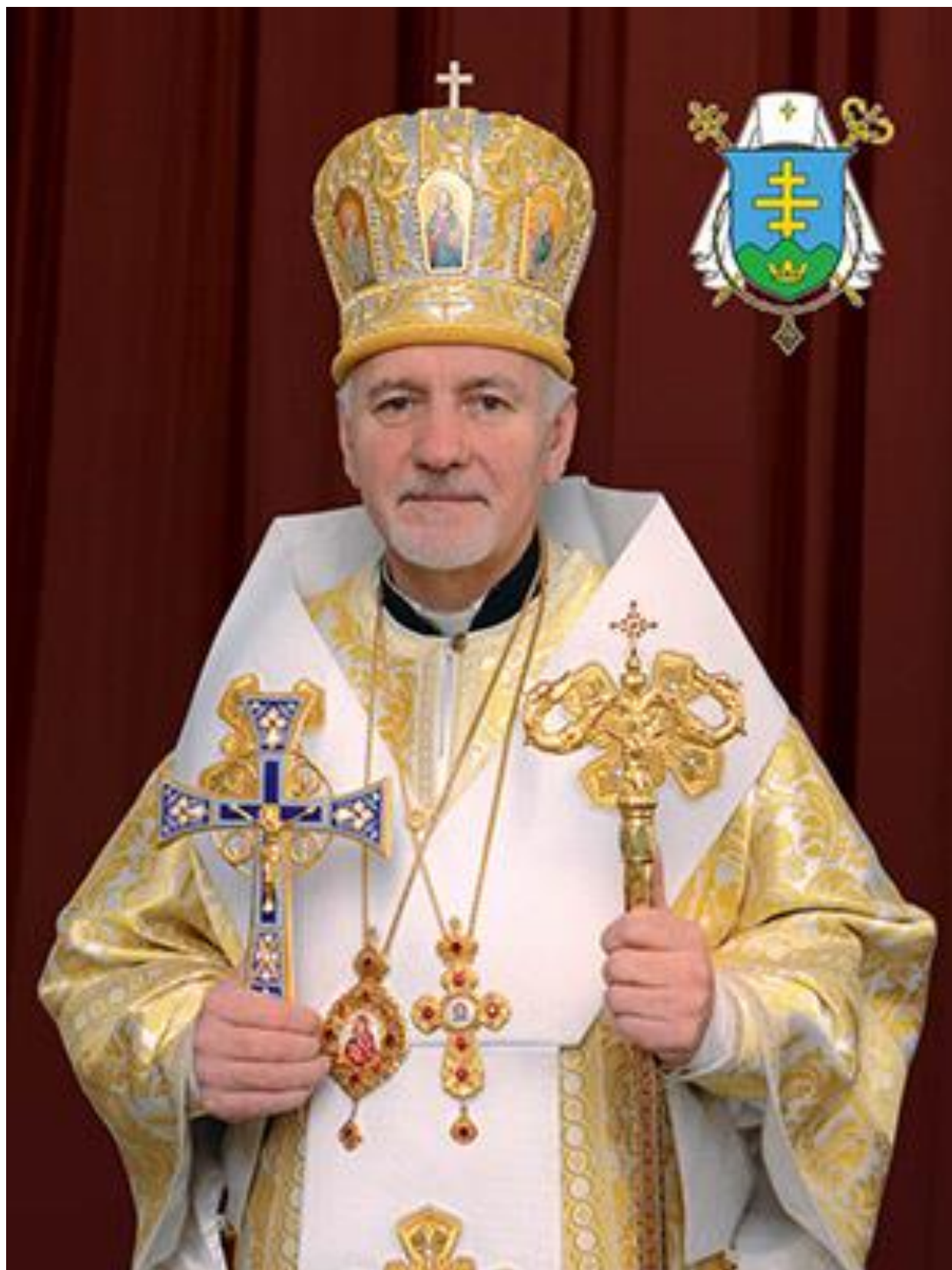
ПРАВЛЯЧИЙ АРХИЄПИСКОП І МИТРОПОЛИТ КИР ВОЛОДИМИР ВІЙТИШИН