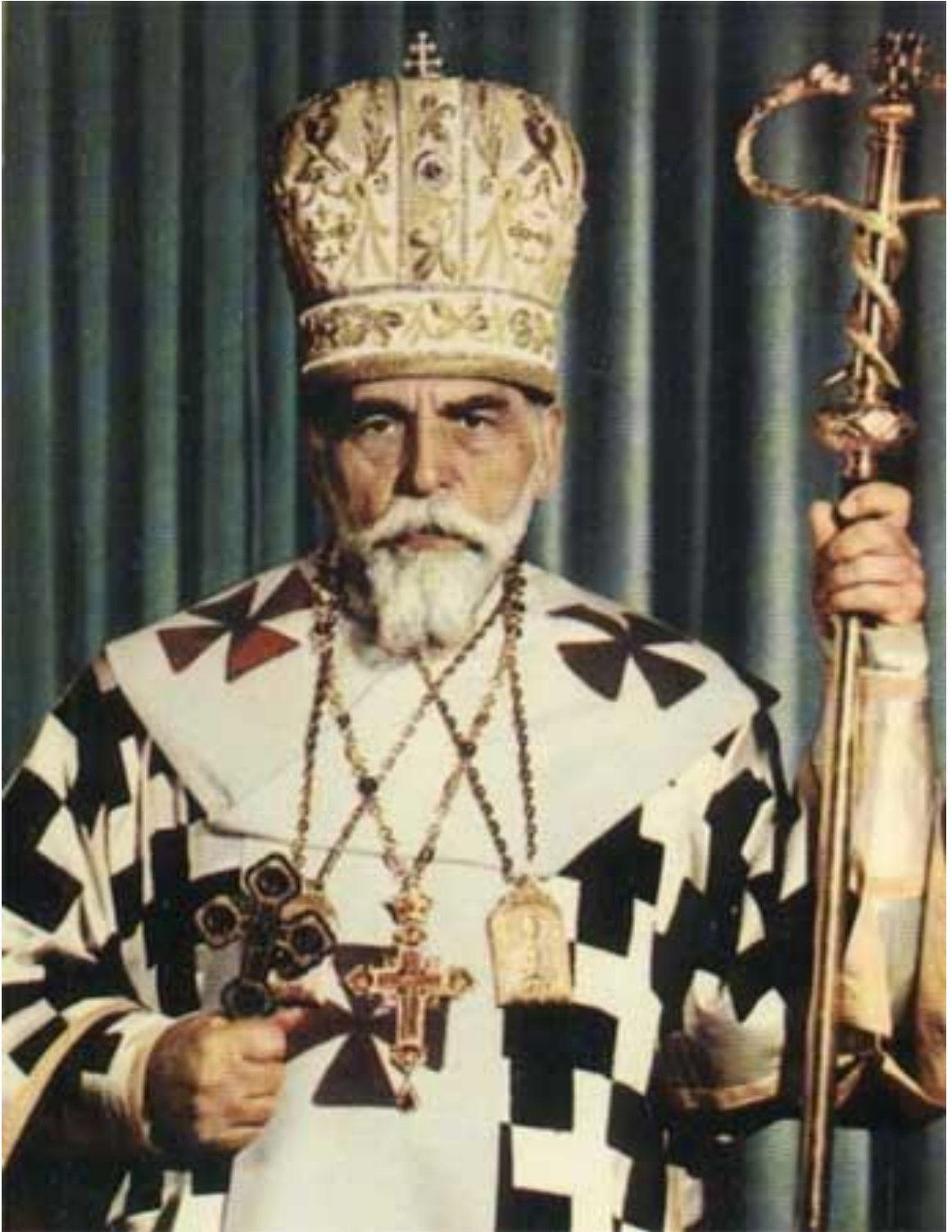
ПАТРІАРХ ЙОСИФ СЛШІЙ