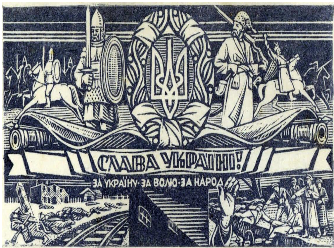
Повстанська графіка Ніла Хасевича «Я не можу битися зброєю, але б'юся різцем і долотом».