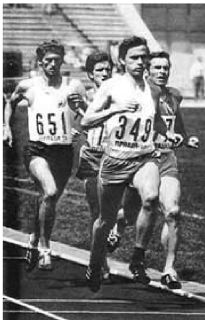
Фото 1. Євген Аржанов (№349)

Цікаво, що норматив майстра спорту в бігу на 800 м Євген виконав всього за кілька місяців тренувань. 1967 року дев'ятнадцятирічний спортсмен перемагає на першості Радянського Союзу серед юніорів. Олімпіада в Мехіко була невдалою. Після неї, змінивши тренера, він виборює перемогу на трьох чемпіонатах Європи: двох зимових (1970–1971 рр.) і одному літньому (1971 р.).