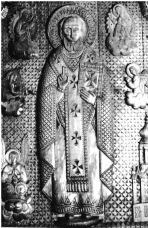
Ікона св. Миколая з бічного вівтаря церкви Івана Богослова з Лугу Делятинського (нині зберігається у церкві Різдва Богородиці смт. Делятина). Майстер – Василь Турчиняк

Іншим витвором різьбяр був іконостас у Ворохті – остання монументальна