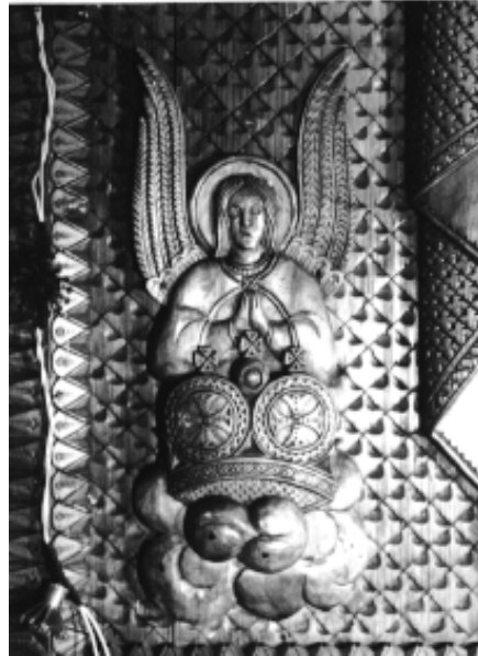
Фрагмент ікони св.Миколая бічного вітваря церкви з Лугу.

На відміну від камерного інтер'єру згаданих церков, інтер'єр лузької церкви, за спогадами дослідниці Г. Лагодинської, “рясний і строкатий, він полонить буянням пластики різьблення” 8 . Інтер'єр церкви належить до кращих витворів різьбярів і є найбільшим за обсягом виконаної роботи. Іконостас складається з двох частин: нижню частину творять царські ворота, намісні ікони та дуги півкіл дияконських дверей. Верхні ряди розміщуються півколом над аркою, до якої прикріплені медальйони ікон святкового ряду. Усі іконні зображення виконані в техніці різьблення по дереву. Найщільніше заповнені різьбою царські врата та дияконські двері. Верхня частина декорована менше, тільки ікони празничного ряду, немов мереживо, оздоблюють завісу верхніх ярусів. Різьба досить рельєфна, що характерно для більшості предметів та деталей інтер'єру у церкві Лугу Делятинського. Ширина іконостасу 5.6 м, висота – 6.95 м. Відповідно ширина і висота царських врат – 1.2x2.6 м, висота царських врат з аркою – 3.15 м,