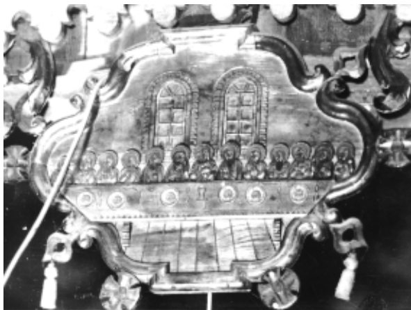
“Тайна вечеря” - ікона празникового чину іконостасу з Лугу Делятинського (нині зберігається у церкві Успіння Богородиці у Биткові) Майстер – Василь Турчиняк

Зображення Святого Миколая – найбільш характерна постать східного християнства. Єпископ-чудотворець у ризах святителя представлений у статичній позі з піднятими до рівня грудей руками. Згідно з каноном його ліва долоня підтримує