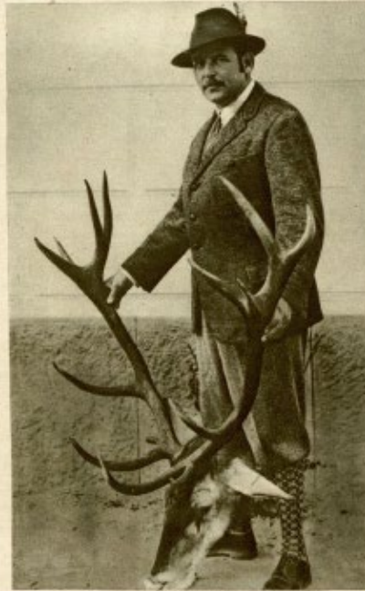
Bar. Königswarter z wieściami czternastaka z Butywni.