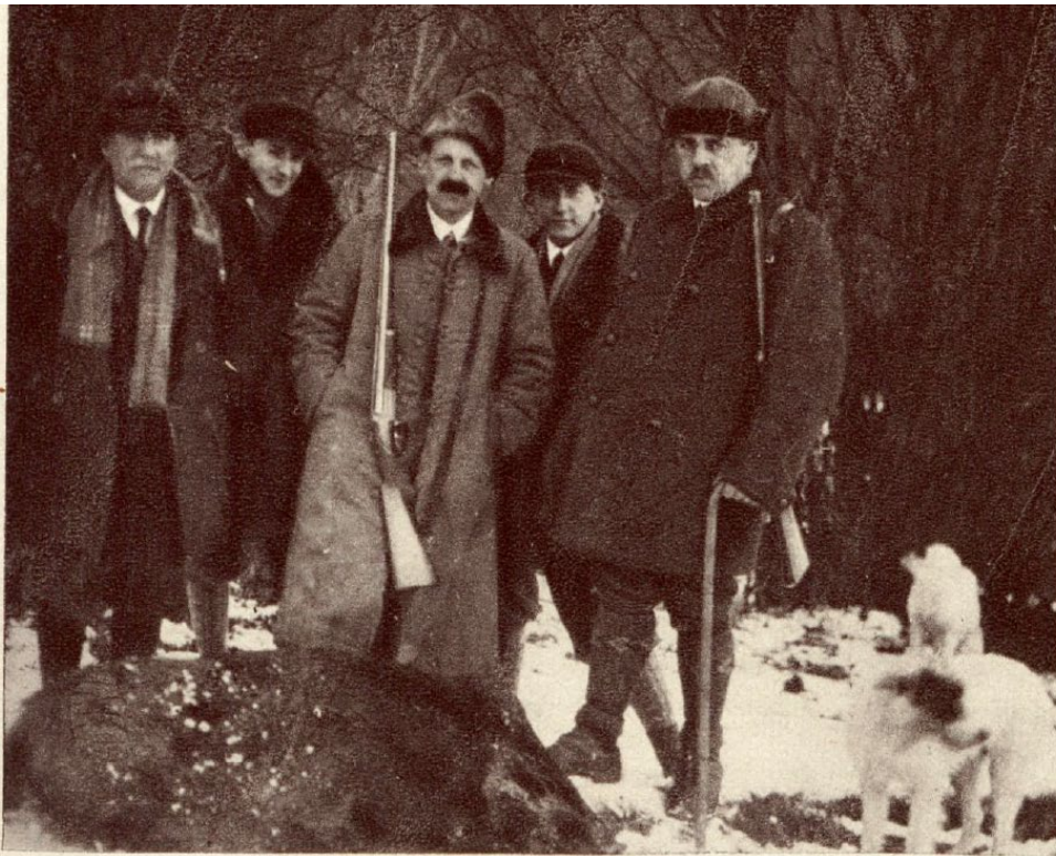
Z Karpackich borów. Nad dzikiem w Kruszelnicy u bar. Groedłów (Bieszczady-Skolszczyzna).