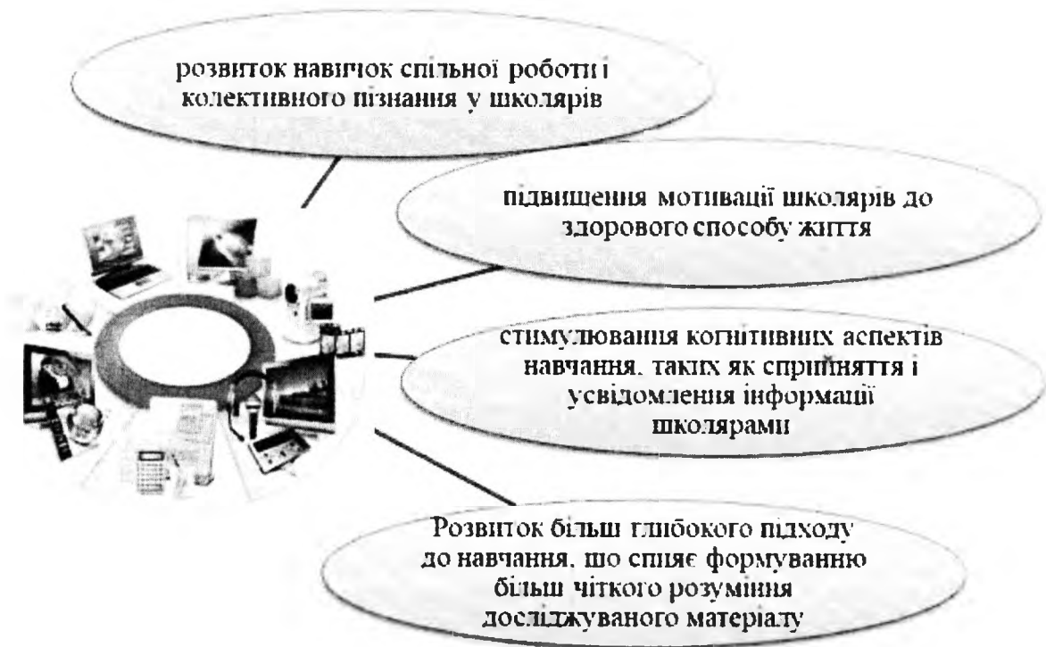
Рис. 1. Переваги використання мультимедіа в процесі адаптивного фізичного виховання [7].

Мультимедійні технології в свою чергу мають певні переваги (рис. 1).