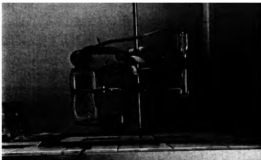
Рис. 1. Устава для визначення вільного метаналу у водних розчинах з використанням газоаналізатора MIC-98170.