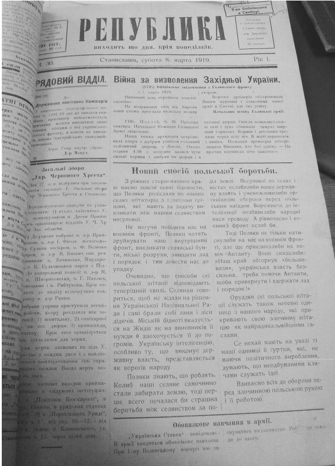
Джерело: Загальні збори «Укр. Червоного Хреста». Републіка. 1919. 8 березня. Ч. 30. С. 1.