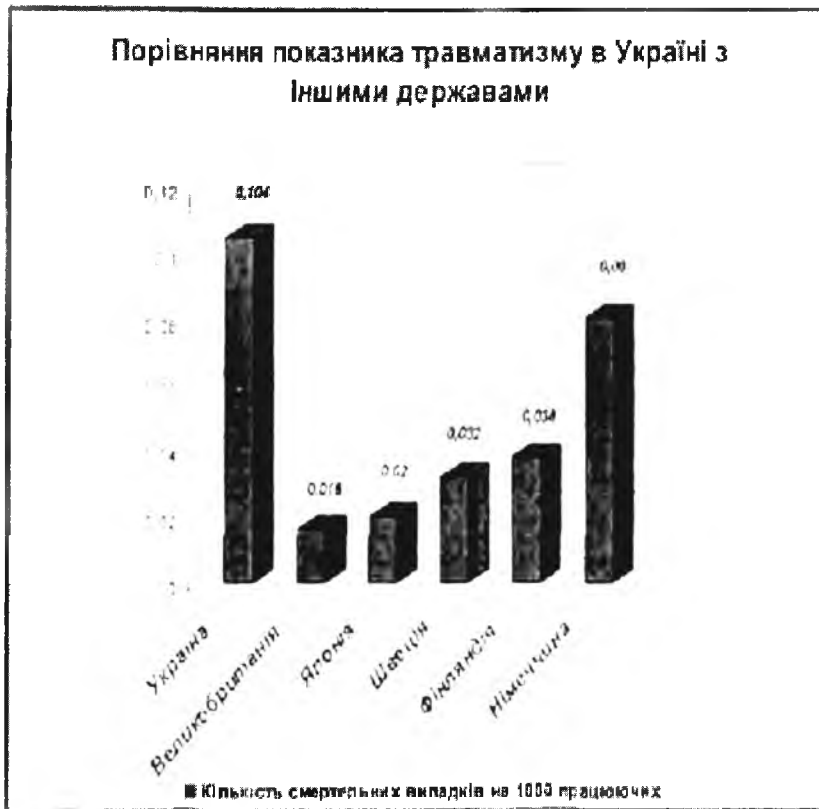
Рис. 2. Порівняння показника травматизму України та інших держав