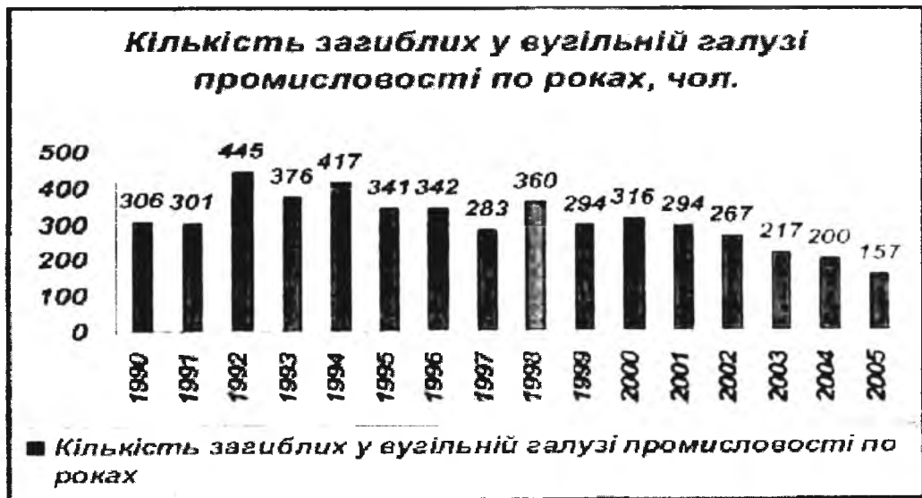
Рис. 3. Динаміка кількості загиблих у вугільній галузі промисловості

В охороні праці особливо актуальною є проблема вибору – між ефективністю та безпекою виробництва, між дешевшими і дорожчими запобіжними заходами, між необхідністю приділяти постійну увагу потребам охорони праці та ресурсними обмеженнями. Тому дуже важливим питанням на етапі розроблення плану заходів з охорони праці на