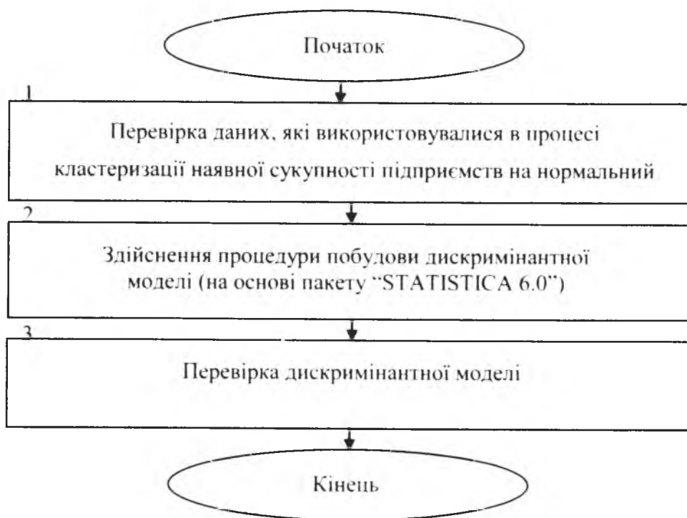
Рис. 2. Алгоритм побудови дискримінантної моделі

7. Мандель И. Д. Кластерный анализ. / М.: Финансы и статистика, 1988./ 176 с.