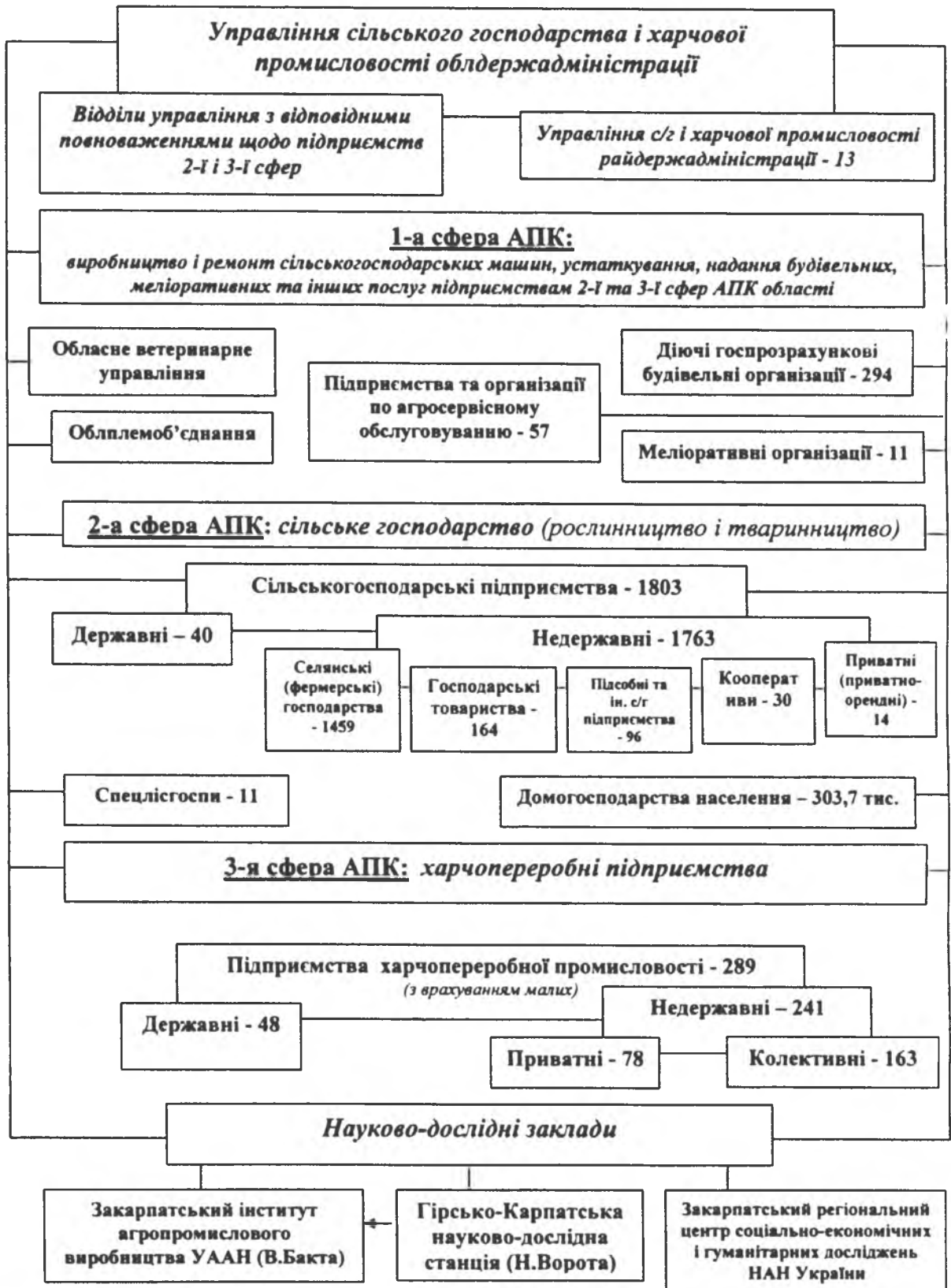
Рис. 2. Трьохсферна модель агропромислового комплексу Закарпаття у 2001 році*