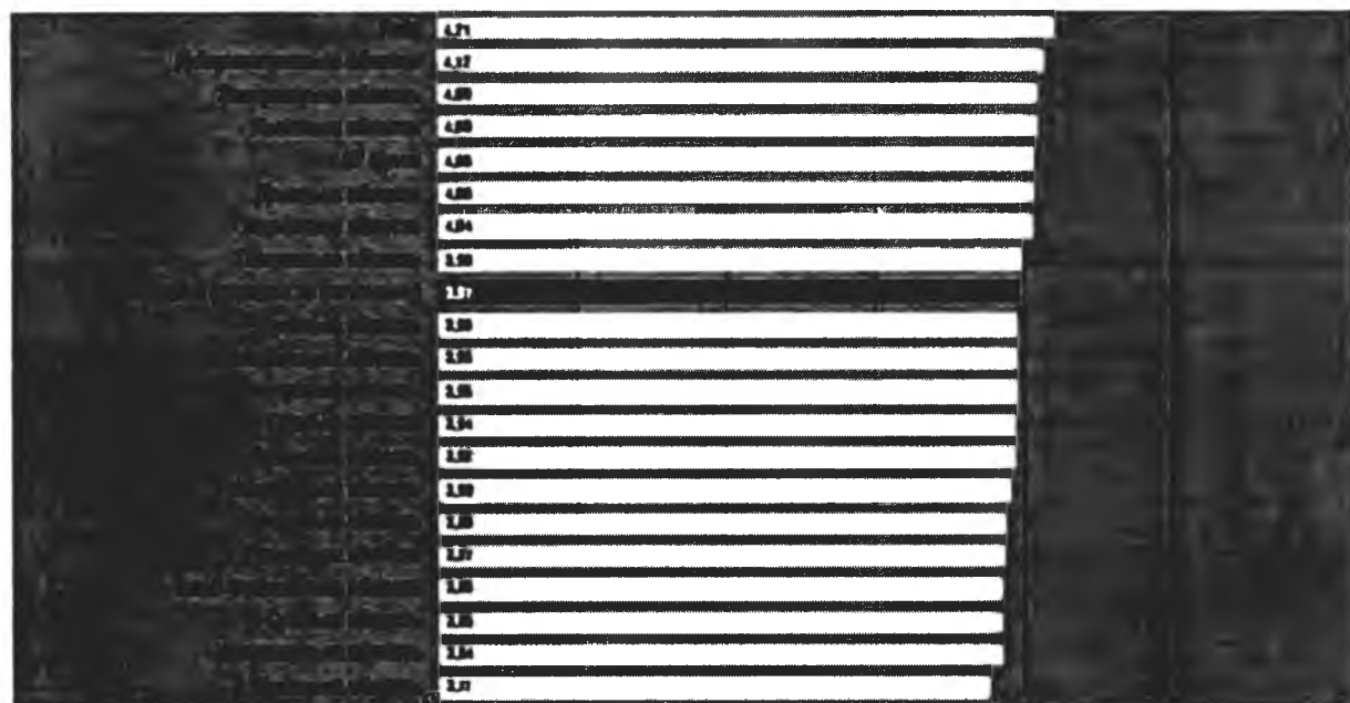
Рис. 2. Індекс регіональної конкурентоспроможності 2009-2010 рр.

яких формуються статистичні дані, що є основою складових ІГК, які могли значно покращити або погіршити оцінку ситуації в регіоні [3].