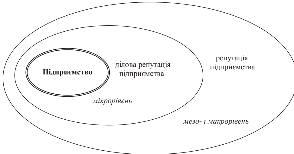
Рис. 2. Наочне відображення масштабів конструювання понять «ділова репутація» та «репутація підприємства»

корпоративної репутації на основі оцінювання її структурних атрибутів.