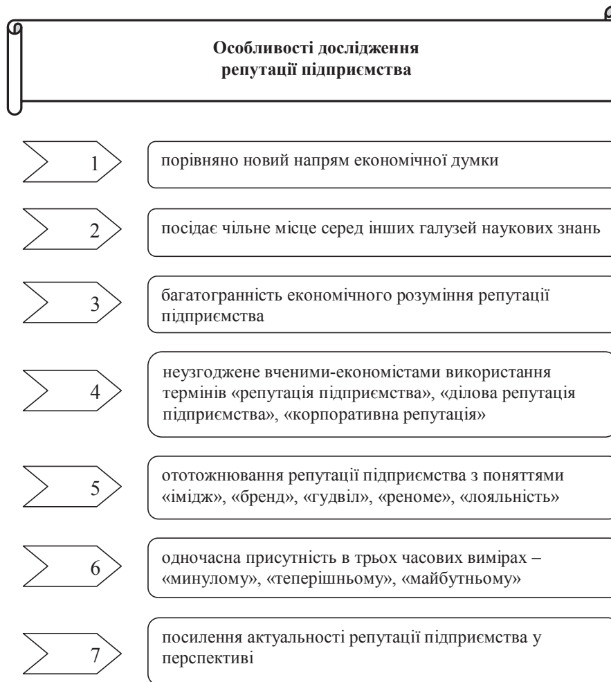
Рис. 1. Характерні особливості дослідження репутації підприємства

та «корпоративної репутації». Авторська позиція пояснюється тим, що «корпоративна репутація» розглядається для підприємств корпоративної форми організації та, в більшості випадків, транснаціональних компаній. Відомо, корпорації являються найдосконалішою формою організації підприємств, які існують переважно у вигляді відкритого акціонерного товариства, засновники яких формують акціонерний капітал шляхом об'єднання виробничих, наукових та комерційних інтересів через механізм випуску і продажу акцій з подальшим делегуванням окремих повноважень централізованого регулювання діяльності кожного з учасників. Такі договірні об'єднання у своїй діяльності на високому рівні впроваджують корпоративну політику, етику ділових відносин, імідж, соціальну відповідальність тощо. Зрозуміло, на такі заходи виділяються значні кошти та чітко контролюються за рівнем їх впровадження і реалізації.