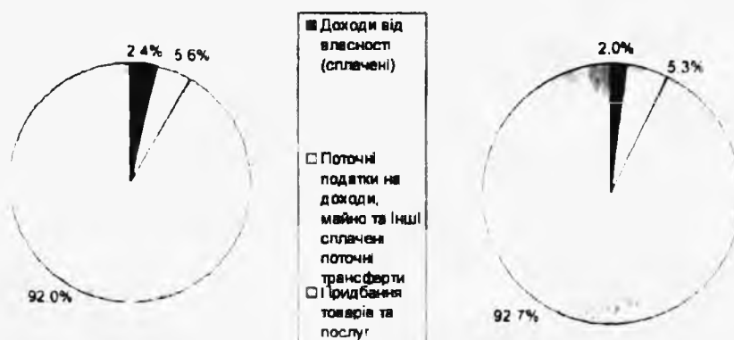
Мал. 2. Структура видатків населення області

Громадськість має бути стурбована тим, що на придбання алкогольних напоїв, тютюнових виробів витрачається майже стільки коштів, скільки на освіту, культуру та відпочинок.