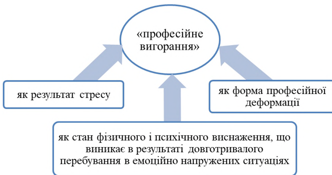
Рис. 1. Феном “професійного вигорання” з погляду психології.

Феномен “професійного вигорання” з точки зору психології вивчається різнобічно.(див. рис. 1).