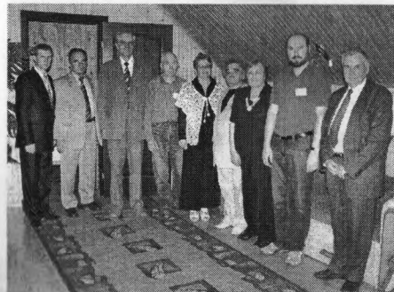
Представники учасників міжнародної конференції України, Росії, Білорусії, Австрії, мікро- та оптоелектроніки, морфологічних, експериментальних та теоретичних досліджень кристалографічних, люмінесцентних, рентгено-структурних властивостей кванто-

Отримані результати підтвердили актуальність вибору головного напрямку конференції. Наочно продемонстровано прагнення фізиків, хіміків, математиків, технологів, розробників та дослідників сучасних приладових структур і приладів нано-, мікро- та оптоелектроніки і сенсорики об'єднати свої зусилля в розв'язанні сучасних проблем створення нових та модернізації існуючих технологій, матеріалів і приладів. Також розглянуто доповіді провідних учених України та інших країн світу з проблем росту тонких епітаксійних плівок і квантово-розмірних структур, розробки, моделювання та аналізу селективних приладів сучасної