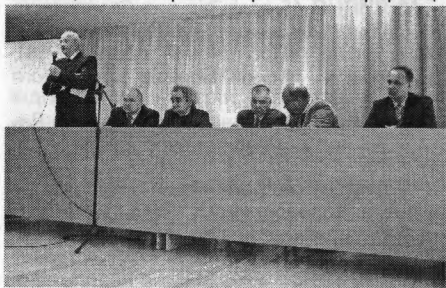
Президія під час відкриття конференції

Для участі в конференції заявлено і подано 528 доповідей від науковців 128 організацій із 13 країн. У роботі конференції