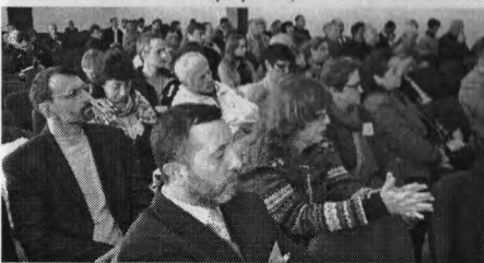
У залі засідань конференції