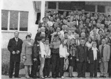
Учасники XIII Міжнародної конференції з фізики і технології тонких плівок та наносистем

півпровідники, діелектрики, провідні полімери) і методи їх дослідження;