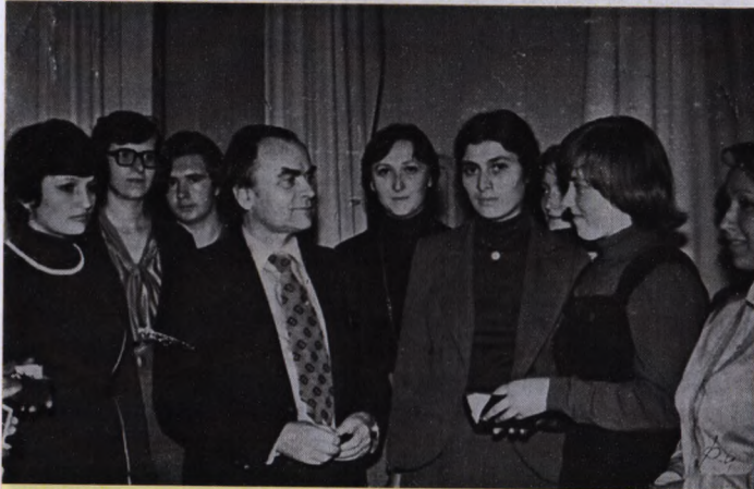
На фото: зустріч поета Д.Павличка зі студентами Станіславського педінституту (1980 р.)

лювались понад 700 студентів. 1976 здано в експлуатацію студентський гуртожиток № 5 на 200 місць.