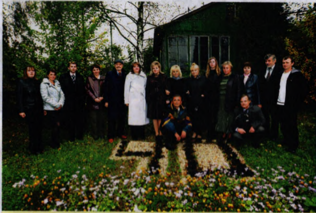
На фото: учасники конференції під час презентації дерев'янистої та трав'янистої флори

30 вересня 2010 року в приміщенні актового зали Прикарпатського національного університету імені Василя Стефаника відбулися урочистості, присвячені 40-річчю від дня заснування Дендрологічного загальнодержавного парку «Дружба» імені З. Павлика.