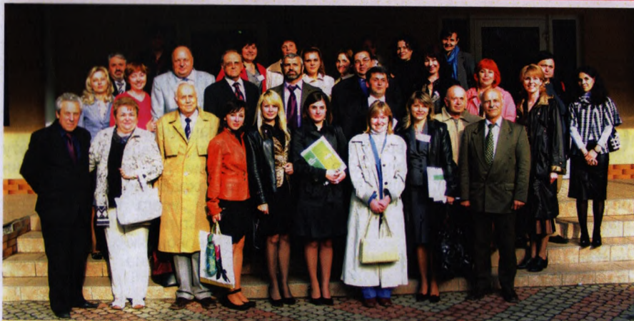
На фото: учасники діалектологічної конференції перед входом до Коломийського інституту

Якщо Прикарпатський національний університет імені Василя Стефаника уявити в образі могутнього дуба, який має потужні корені і крилату крону, то Коломийський інститут можна прирівняти до однієї з багатьох молодих гілочок цієї крони. І справді, інститут молодий, створений 1999 року, але, завдячуючи сімдесятилітнім здобуткам університету, його авторитетові та досвідові, поволі завойовує своє місце серед навчальних закладів на Покутті.