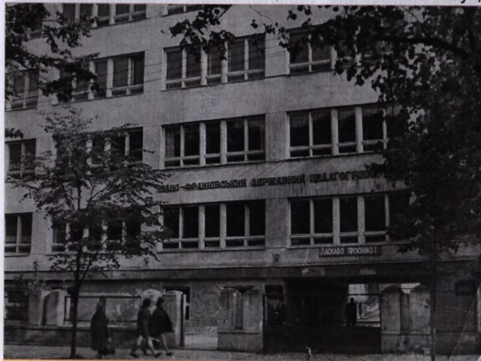
На фото: Івано-Франківський державний педагогічний інститут (1969 р.)

та російської мови і літератури розділено на окремі кафедри мови і літератури та зарубіжної літератури. 1971 на філологічному факультеті була введена спеціальність «Англійська мова». 1973 створена відповідна кафедра, а наступного року — кафедра іноземних мов. 1975 відкрито факультет іноземних мов, на якому (крім англійської) створено кафедру німецької мови.