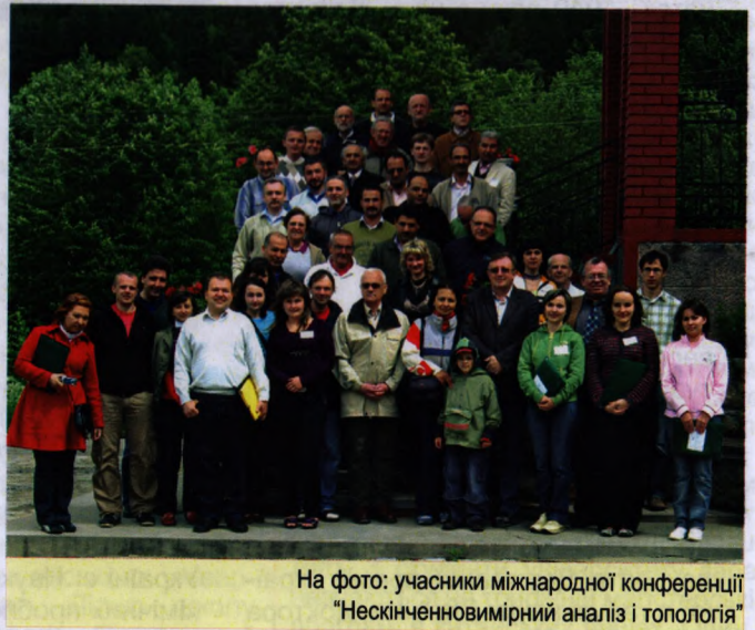
На фото: учасники міжнародної конференції “Нескінченновимірний аналіз і топологія”

2009 року факультетом організовано і проведено надзвичайно потужну Міжнародну наукову конференцію «Нескінченновимірний аналіз і топологія», учасниками якої були найвідоміші фахівці цієї галузі з майже 30 країн світу. Міжнародна співпраця ведеться згідно з угодами, укладеними з Північним університетом (м. Бая-маре, Ру-