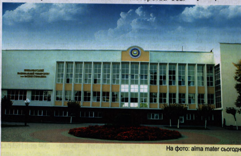
На фото: alma mater сьогодні