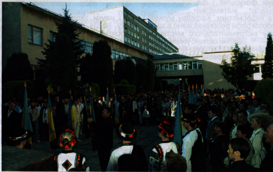
На фото: 1 вересня в університеті

2001 на базі педагогічного факультету почав діяти Педагогічний інститут, а на базі художньо-графічного та музичного факультетів – Інститут культури і мистецтв.