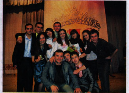
На фото: студентський профком

Д вері профспілки завжди відчинені для відвідувачів, вуха завжди вдячні за похвалу та пропозиції, а руки готові до співпраці.