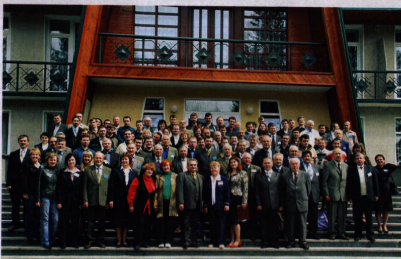
На фото: учасники XI Міжнародної конференції з фізики і технології тонких плівок та наносистем МКФТТПН-XI

ням ВАК України визнаний фаховим виданням з фізико-математичних, хімічних та технічних наук.