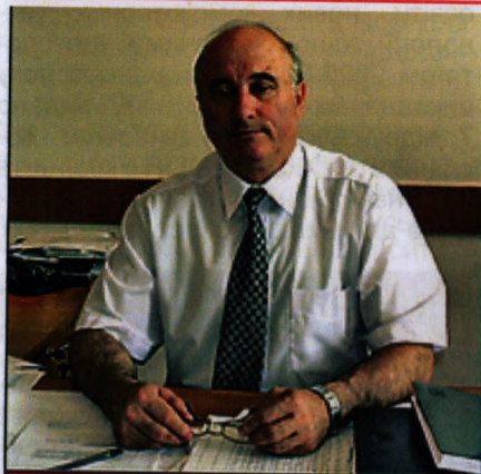
Без потужної наукової бази ефективна економіка неможлива

“Наша інтеграція у світове співтовариство набуває інноваційного змісту”