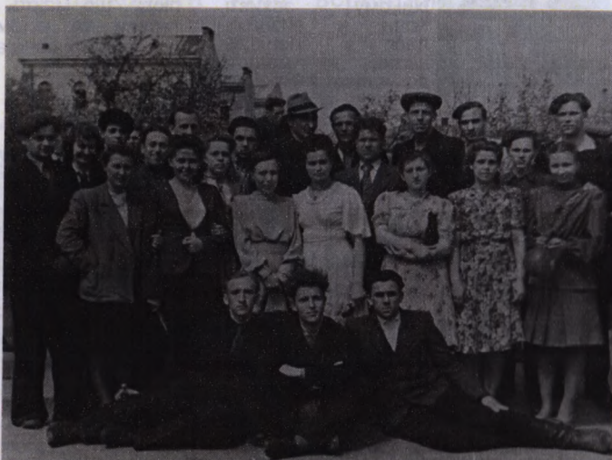
На фото: студенти II курсу фізмату зі своїми викладачами (1949 р.)

За період діяльності Станіславського вчительського інституту його закінчили і отримали дипломи вчителів із середньою спеціальною освітою 1517 випускників.