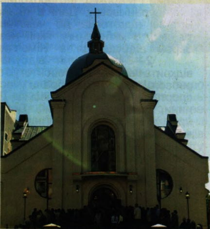
На фото: відкриття храму