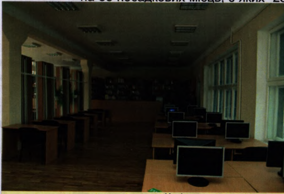
На фото: нова читальна зала

30 серпня 2010 року відкрито нову читальну залу фізикоматематичних та економічних наук на 55 посадкових місць, з яких 25