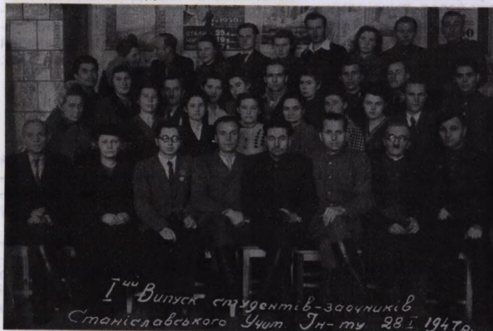
І-й випуск студентів-заочників Станіславського Учпт. Ін-ту 28 І 1947р.

Директором інституту призначено викладача педагогіки Станіславської педагогічної школи