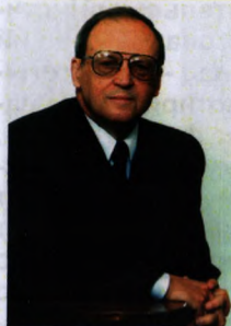
Віталій Кононенко, академік НАПУ, почесний ректор

— Університету лише 18 років, а це вік зовсім молодого людини. Тому в нього ще все попереду: і справжня зрілість, і мудрість, яка вимагає випробування часом. Наш університет з молодих та ранніх.