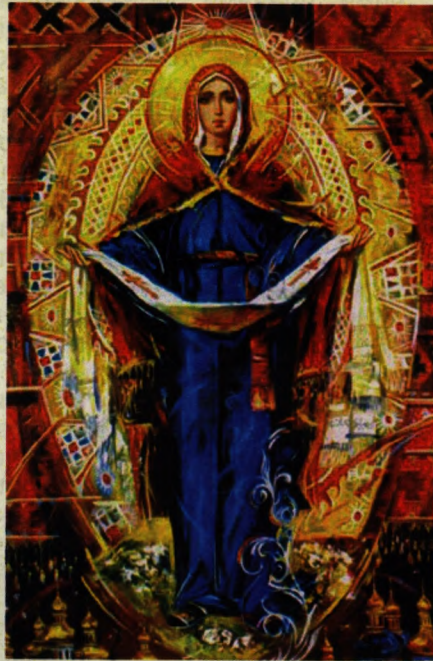
У Карпатській Україні до Покрови остаточно поверталися

14 жовтня – свято Покрови Пресвятої Богородиці. Це свято козацьке і загальноукраїнське. Покрова – час, коли замирає природа, земля починає покриватися листям та першим снігом. Тому дослідники вбачають у цьому святі відгомін культу Сонця та Матері-Землі. Сонце щодня заходить за Землю, яка його “покриває”, а вранці знов “народжує”. Звідси й уявлення про вічне воскресіння та Землю-Покрову і Богородицю Діву. Саме Жінці-Матері, Землі-Берегині, Богородиці Діві Покрові поклоняються козаки. Оскільки смерть чекала воїнів на кожному кроці, вони завжди носили із собою грудку рідної землі, щоб вона оберігала їх у військовому поході. А коли козак гинув, то побратими посипали могилу цією землею.