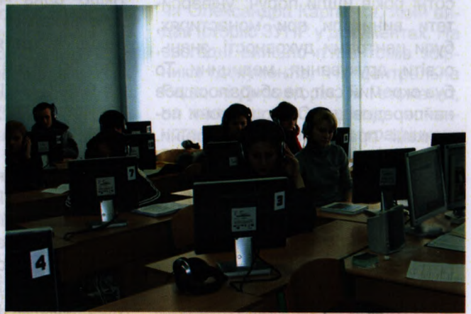
На фото: на практичному занятті

Студенти факультету іноземних мов активно беруть участь у різноманітних міжнародних програмах, навчаються в Австрії, Великій Британії, Німеччині, США, Китаї.