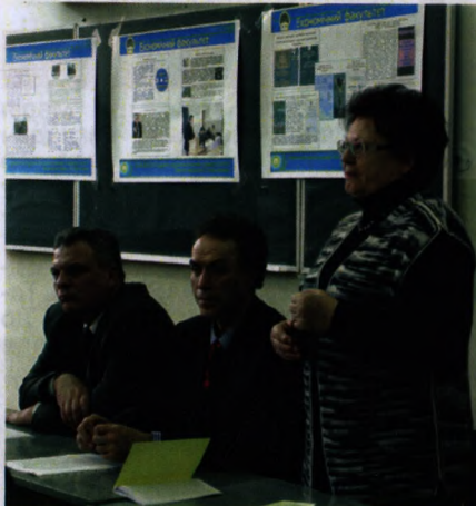
На фото: день відкритих дверей на економічному факультеті (квітень 2010 р.)

Щодо роботи за професійним спрямуванням, то слід зазначити, що вона передбачає ряд заходів щодо формування почуття гордості за обрану професію економіста, спеціаліста фінансово-кредитної та обліково-аудиторської справи. Ввійшло в практику проведення на факультеті зустрічей з керівниками банків, директорами провідних підприємств та установ Івано-Франківська, Калуша, Коломиї, Долини, де проходять навчально-виробничу практику студенти випускних курсів факультету.