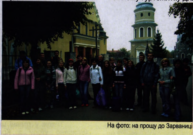
На фото: на прощу до Зарваниці

його мешканців до проведення заходів, направлених на поліпшення житлових і санітарно-побутових умов, перепускного та санітарного режиму, про-