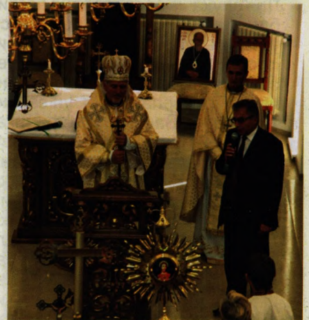
На фото: слово ректора до мирян

У День Різдва Пресвятої Богородиці в Івано-Франківську відкрита і освячена Владикою Володимиром Війтишиним, Єпархом Івано-Франківської УГКЦ церква, названа на честь Божої Матері. Близькість Божого Храму до потужного і розвинутого освітянського центру, яким є Прикарпатський національний університет, сприяє формуванню і становленню єдиного духовно-просвітницького осередку виховання студентської молоді Прикарпаття, адже недарма його називають “університетським”.