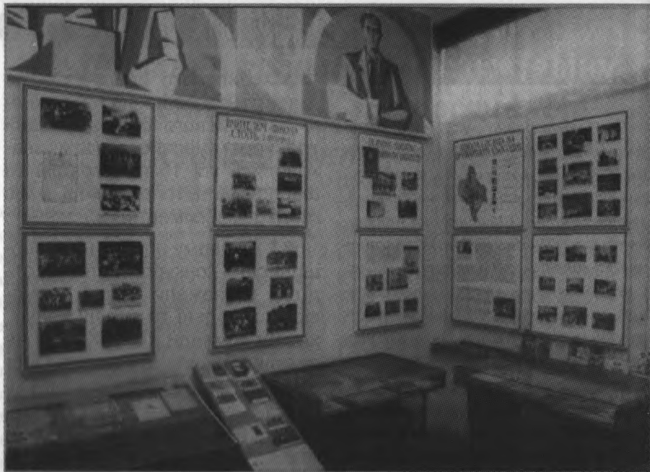
Фрагменти експозицій "Освіта на Прикарпатті у 1944 - 1990 рр та "Освіта на Івано-Франківщині у 1990 - 2007 рр."

К рім того, що в музеї досить ґрунтовно на унікальних документальних матеріалах пока-