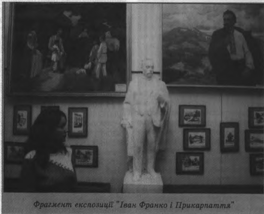
Фрагмент експозиції "Іван Франко і Прикарпаття"

ляють і Прикарпаття. Зберігаються та експонуються вони в 16 державних, 100 громадських та декількох приватних музеях. Об'єднані ці колекції туристичним маршрутом "Музейне коло