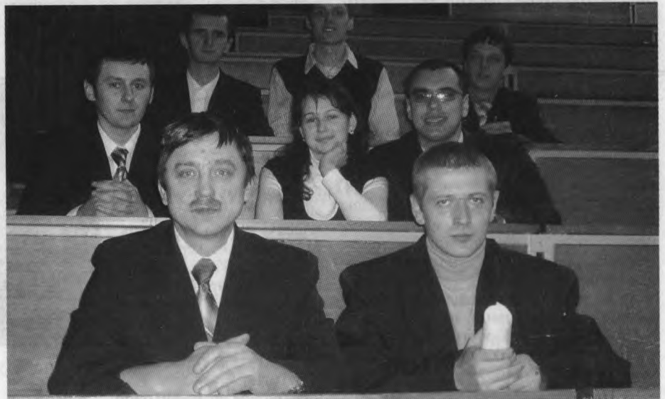
Перед фінальним боєм

ступеня на Всеукраїнському турнірі, що було наслідком накопичення ігрового та наукового досвіду... Цього року ми вперше потрапили до двійки кращих вишів України, що й дало можливість проявити