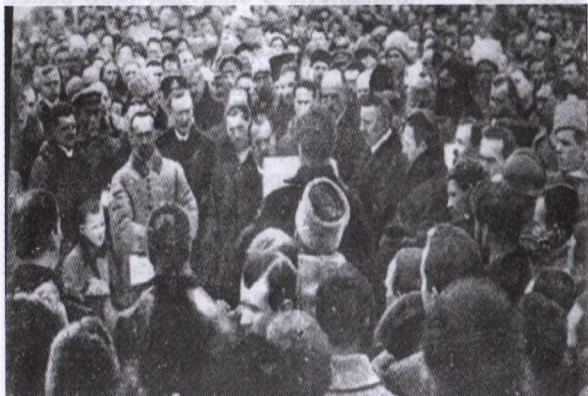
Мітинг в Києві з нагоди проголошення Акту злуки УНР та ЗУНР в єдину соборну державу. 22 січня 1919 р.

Це свято відзначаємо щороку в день проголошення Акту возз'єднання Української Народної Республіки й Західно-Української Народної Республіки, що відбулося 1919 року. Офіційно в Україні День Соборності відзначають з 1999 року. 22 січня 1918 року в