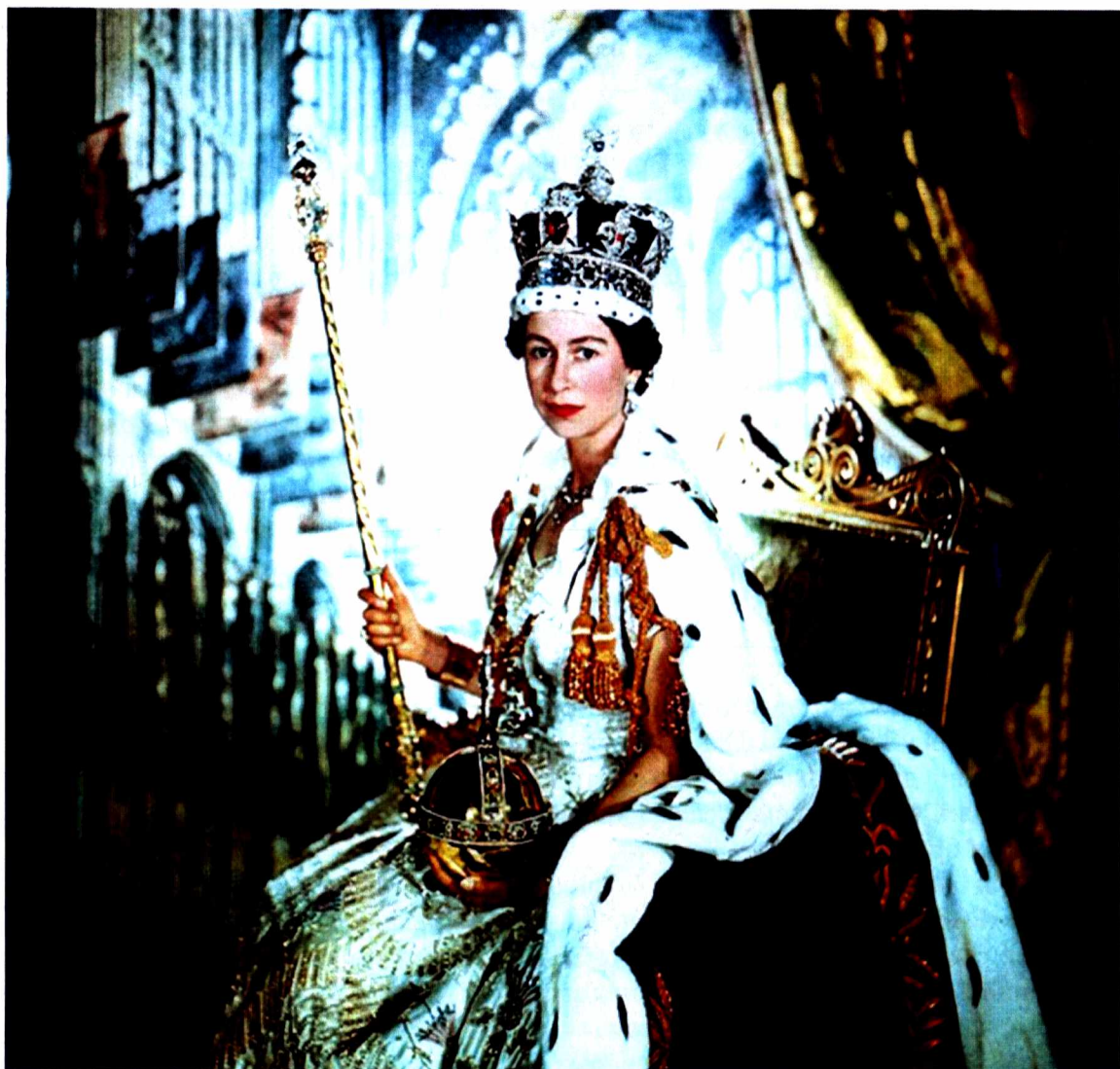
2 червня 1953 р. Коронація Єлизавети II.