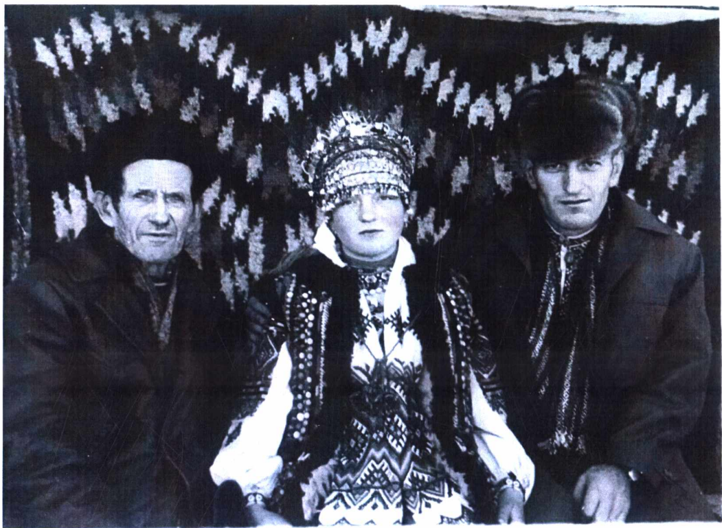
Фото 6. Гуцульське весілля 1975 р.