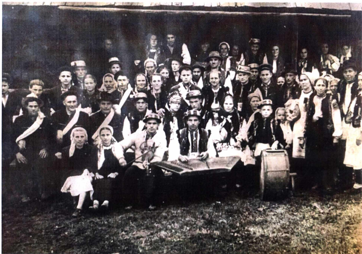
Фото 4. Гуцульське весілля в 70-х рр. ХХ ст.