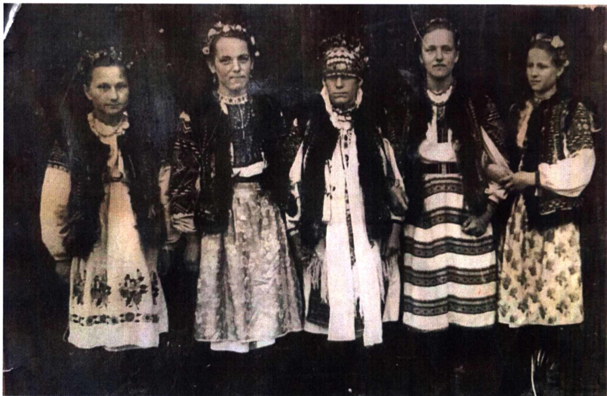
Фото 5. Наречена з дружками. Весілля в 50-х рр. ХХ ст.