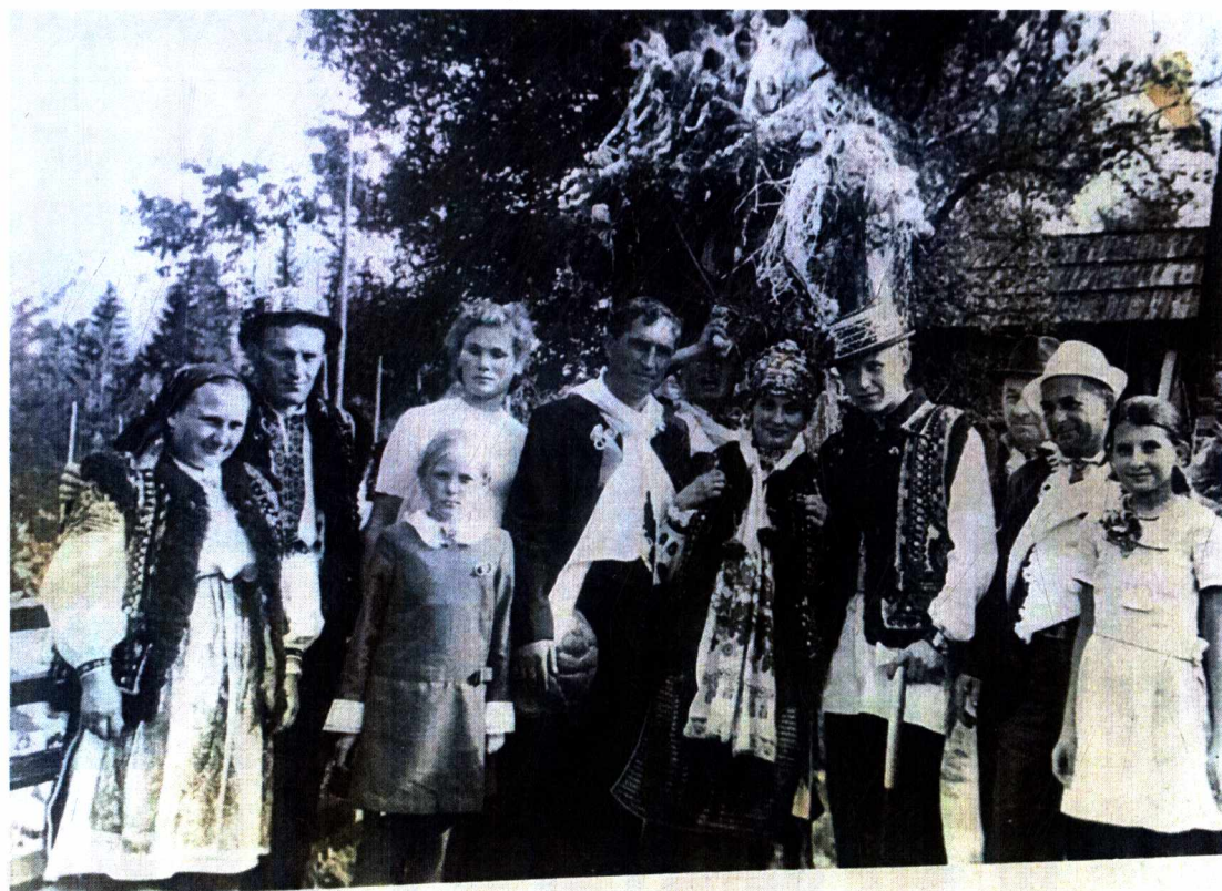
Фото 3. Гуцульське весілля в 70-х рр. XX ст.