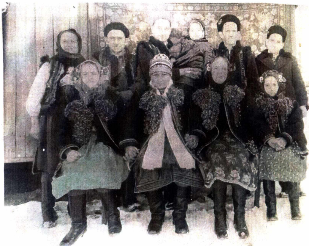
Фото 2. Весілля 29 січня 1961 р.