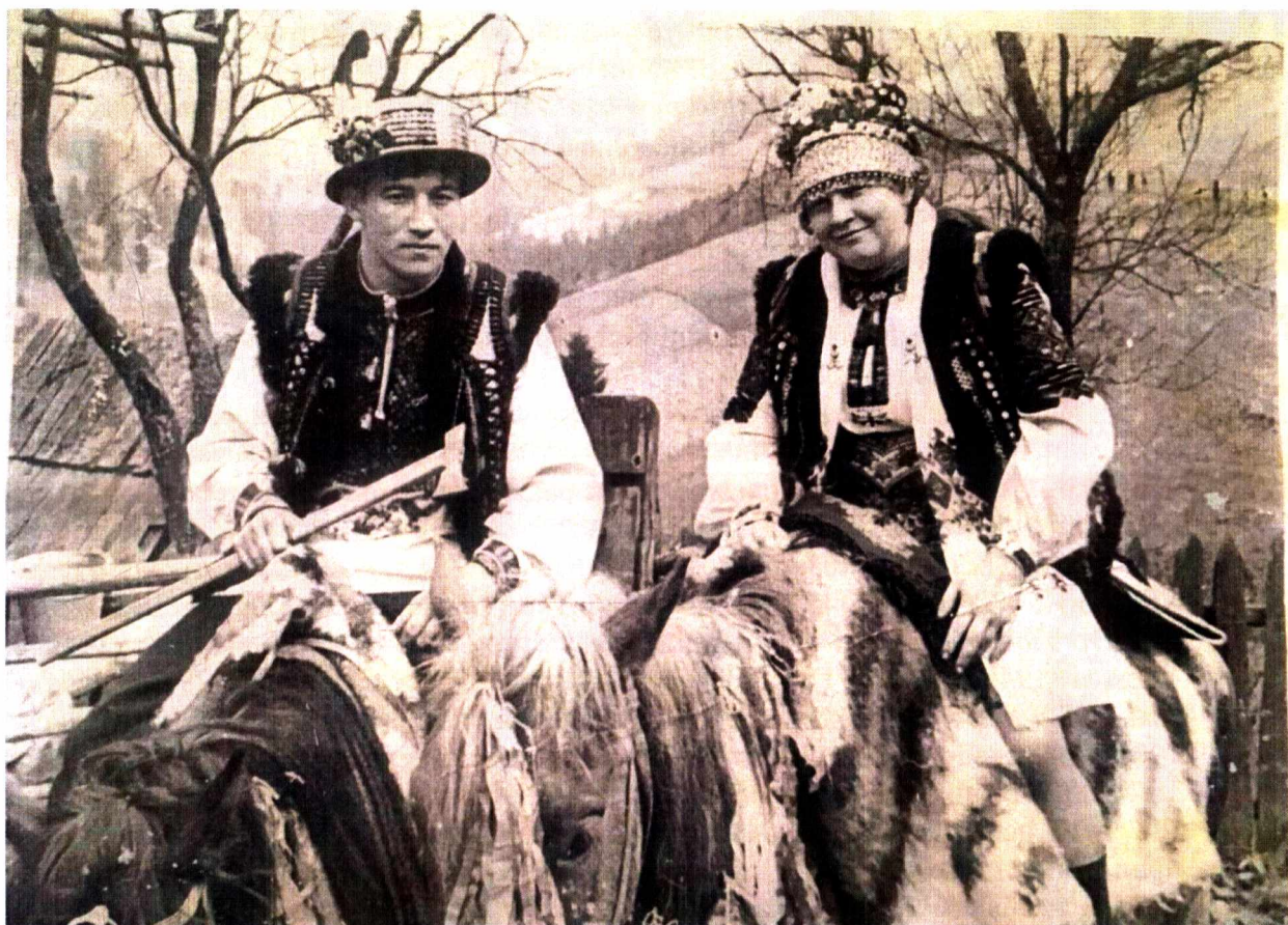
Фото 8. Гуцульські наречені на конях. Фото 60-х рр. ХХ ст.