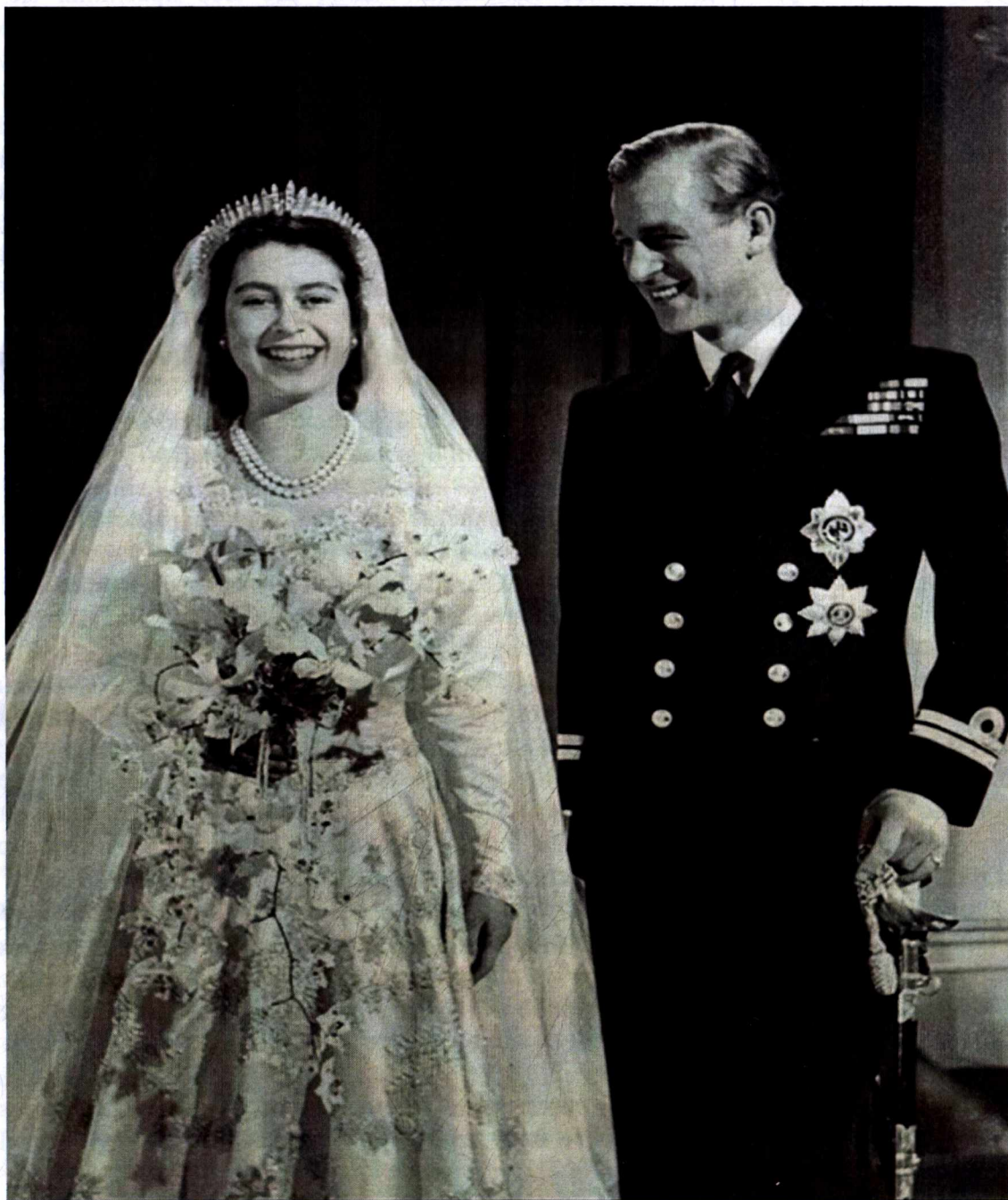
Весілля принцеси Єлизавети II і принца Філіпа, 20 листопада 1947 р.