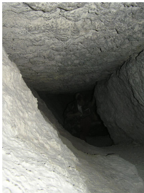
Рис. 3. Прохідний коридор

Зворотній шлях туристів проходить вздовж аркоподібного утворення, яке сформувалося внаслідок взаємодії гравітаційних і карстових процесів (склепіння двох блоків) у приповерхневій частині. Найкращий час для подорожі цим маршрутом – квітень – жовтень.