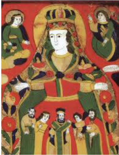
Покрова Пресвятої Диви Марії

Особливо цінувалися ікони з великими і яскравими формами, які виразно прочитувалися на білій стіні, навіть у не зовсім добре освітленому помешканні. Такі ікони ставали домінантою оселі, найяскравішою «плямою», де все інше в інтер'єрі – скатертини, рушники, жердка зі святковим одягом, розмальована піч – були доповненням або навіть своєрідним «обрамленням» цих ікон. «Може тому ікона на склі з її вічно яскравими полум'яніючими кольорами й полюбилася демократичним верствам віруючого люду, що вона виділялася серед побутових речей житла, підкреслюючи важливість, окремішність цього образу» [3, с. 97].