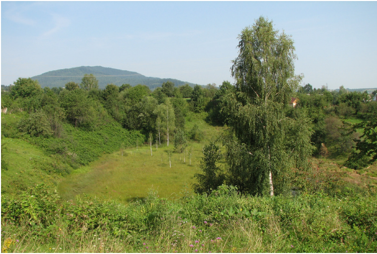
Рис. 2. Карстова лійка в ур. Погребнич (2010 р.)