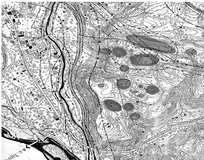
Рис. 1. Картоschema поширення карстових форм рельєфу в смт. Делятин

і діаметром 10–50, іноді до 200 м. Окремі ділянки прямокутної форми мають значні розміри – 40×120 м, інші лійкоподібні. Дно лійок в більшості випадків заболочене та вкрите болотяною рослинністю і деревами (береза, вільха). Ці форми виникли в соленосних відкладах воротищенської світи, які залягають близько до поверхні під малопотужним шаром галечників і суглинків. Потужність шару соленосних відкладів від 100 до 1100 м.