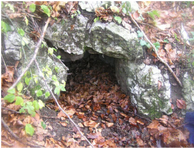
Рис.2. Вхід до печери «Тепла»

Зворотній шлях туристів лежить через ліс і далі узліссям до околиць села Темирівці, де в кінці мандрівки можна відпочити у спеціально облаштованому місці і поділитися враженнями про побачене. Найкращий час для подорожі цим маршрутом – червень-жовтень.