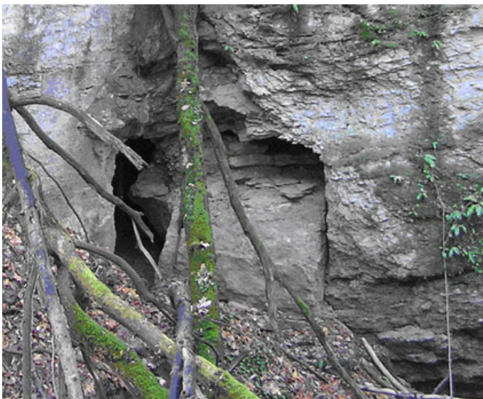
Рис. 1. Печера Двопелюсткава в урочищі Пом'ярки

Печера «Сліпої вчительки», яка розміщена в урочищі «Скеля» за розмірами відноситься до малих форм 14x4x4 м. При вході з правого боку є ніша, яка у минулому використовувалася для сакральних цілей. В середині печери у стелі є отвір прямокутної форми шириною 0,5 м і довжиною 1 м у вигляді димоходу. З обох боків у печері у шахматному порядку витесанні три сидіння (лежанки), які за переказами жителів слугували для сидіння. Ця форма є наскрізна (з південного боку отвір напів-еліпсоподібний, з північного боку вхід), суха.