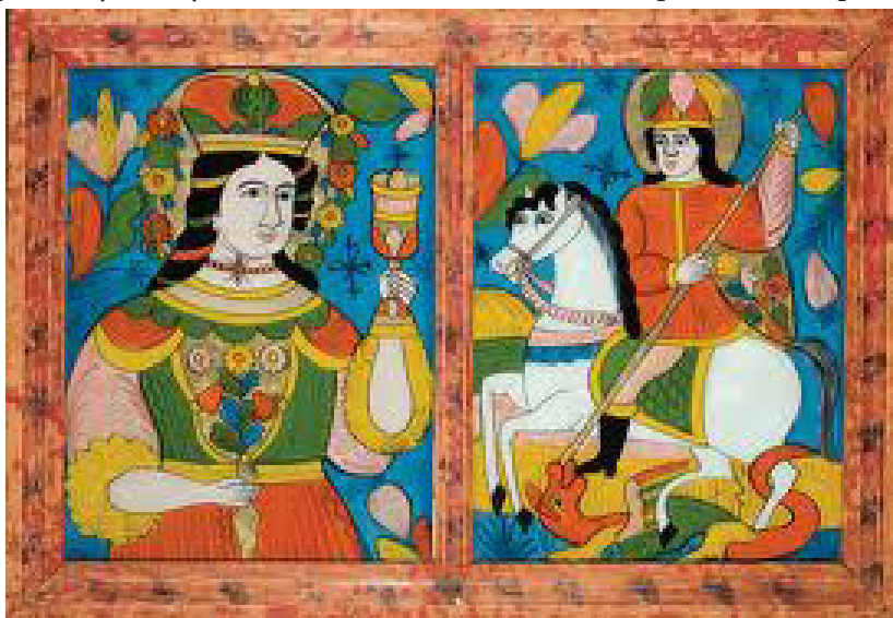
Свята Параскева і Святий Юрій Змієборець

Ікони мальовані на звороті скла продавалися на численних базарах, базарчиках і на них був великий попит. В українській оселі до цих ікон молилися у свята та будні, на Різдво і у Великдень, у дні народження і смерті, вона була ще одним, найважливішим «вікном», звідки дивилися святі, яким вірили і яких просили.