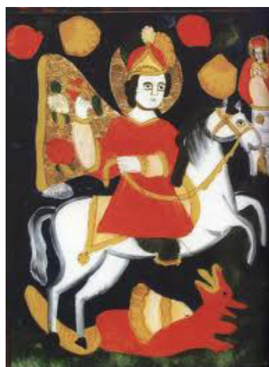
Святий Юрій Змієборець