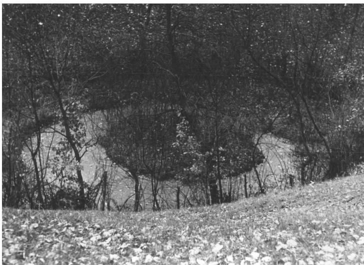
Рис. 4. Карстова лійка з плаваючим острівцем в ур. Погребнич (1976 р.) [4]

Загалом слід відмітити, що активізація та активність карстових процесів в смт. Делятин була пов’язана переважно з промисловим виробництвом солі в XVIII–XIX ст. Саме в цей період були створені дуже хороші умови для розвитку карстових процесів та утворились перші карстові форми рельєфу. Після припинення промислового солеваріння умови, які сприяли розвитку даного процесу, погіршилися і привели до мінімального розвитку карстоутворення. В кінці XX на початку XXI століть ці процеси майже припинилися, тільки під час випадання зливових дощів інколи відкриваються на поверхню нові карстові форми, які скоріш за все були утворені в минулому, проте були покритими шаром відкладів.