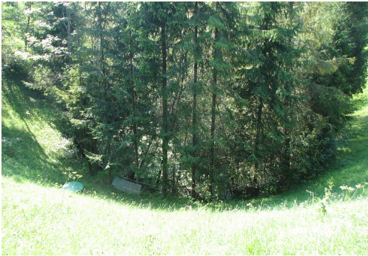
Рис. 3. Карстова лійка з плаваючим острівцем в урочищі Погребнич (2010 р.)

Не тільки в урочищі Погребнич відомі виходи на поверхню джерел соляної ропи, ними також багате урочище Посіч. У той же час, в урочищі Погребнич зафіксовані карстові форми, а в урочищі Посіч їх не виявлено. На нашу думку, це пов'язано зі зміною рівня ґрунтових вод під час промислового видобування солі в XVIII–XIX ст., внаслідок чого там активізувалися карстові процеси.