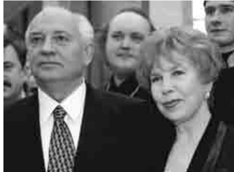
Михаил и Раиса Горбачевы

Во-вторых, у Михаила Сергеевича с Раисой Максимовной рано проявилась тяга к заграничным путешествиям, которым они посвящали отпускное время. Таким образом, в середине 80-х гг. они знали свободный мир отнюдь