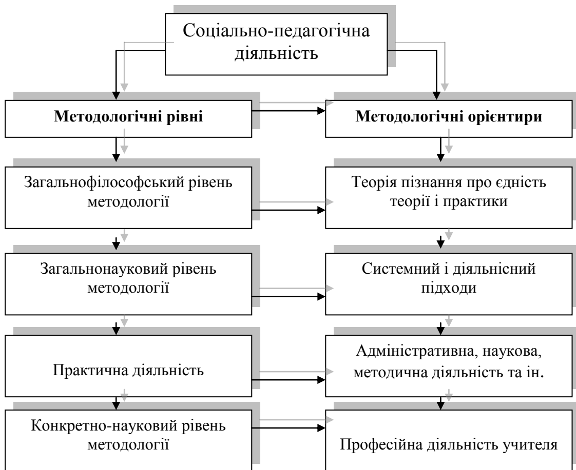
Рис. 1. Методологічні рівні дослідження соціально-педагогічної діяльності (згідно теорії В. Краєвського)

На основі методологічного принципу пізнання реальної дійсності про єдність теорії і практики вдаємося до проектування соціально-педагогічної діяльності на тлі відповідного середовища (Рис. 2).