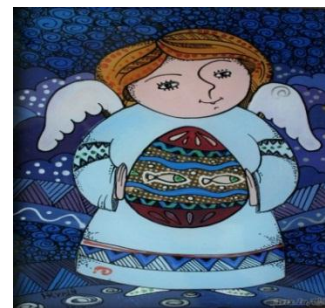
Рис.9. Малярство на склі. «Ангел і писанка». Автор Курій-Максимів Н.