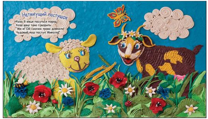
Рис. 11. Ілюстрація Г.Осадко

На процес образостворення впливає рівень образної пам'яті. Образна пам'ять – це вид пам'яті, за характером переважної психічної діяльності, тобто пам'ять на уявлення: зорова, слухова, нюхова, смакова, дотикова. У процесі інтегрованих уроків образотворчого мистецтва та трудового навчання для формування в учнів вміння створювати художній образ, одним з основних завдань вчителя є активізувати в пам'яті учнів попередні враження про об'єкти й суб'єкти навколишньої дійсності та спонукати утворювати нові комбінації асоціативних зв'язків між ними. Цей процес може набувати різного рівня складності, залежно від мети, змісту й попереднього досвіду учнів. Так, під час проходження практики у загальноосвітніх школах, студенти педагогічного факультету спеціальності початкова освіта, пропонували учням молодшого шкільного віку виконати такі завдання: їм демонстрували ілюстрації, у техніці малювання по склі до книги Романа Скиби «Рибне місце» [16], української письменниці, художниці, ілюстратора Ганни Осадко (рис. 11) і пропонували розглянути ілюстрацію, вирізнити окремі елементи й назвати кілька інших слів, які спадають на думку. Наприклад: «хмара» – «дощ», «хмара» – «біла», «хмара» – «кучерява», таким чином утворюючи асоціативні зв'язки між елементами зображення. Спостереження показали, що учні 1–2 класів можуть показувати близько п'ять ознак об'єктів та асоціативних зв'язків між ними. Учні 3–4 класів зосереджують увагу на значно більшій кількості суттєвих ознак і асоціацій.