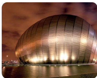
Рис.7. «Титанічне яйце». Кінотеатр Наукового центру Глазго (Шотландія)

Як бачимо, художній образ є результатом злиття об'єктивного та суб'єктивного, матеріального та духовного, зовнішнього і внутрішнього. Спостереження зразків художнього мистецтва, технічних об'єктів, окремих засобів виразності (матеріалу, композиції, силуету, форми, кольору, техніки виконання) допомагає закласти основу для вміння бачити художній образ з позиції окремих характерних рис, так і з позиції його цілісності й закінченості. У процесі спостереження поданих зразків учні можуть переживати певні емоційні відчуття: