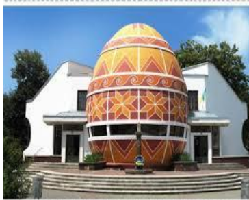
Рис.5. Музей «Писанка» м. Коломия(Україна)