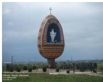
Рис.6. Пам'ятник с. Братківці Львівська обл. (Україна)