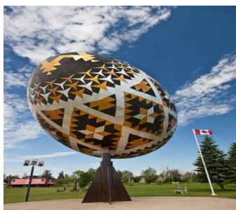
Рис.4. Пам'ятник писанці у Канаді