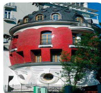
Рис. 8. Центр сценічних мистецтв «Яйце»