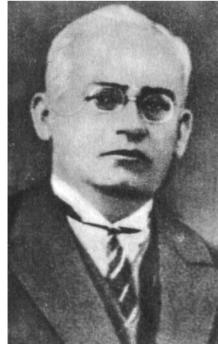
Академік М.М. Крилов