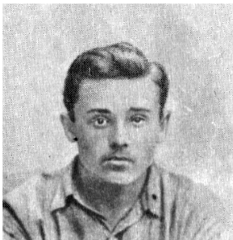
С.П. Корольов – студент Київського політехнічного інституту, майбутній академік, конструктор ракетно-космічних систем. Учень М.П. Кравчука.

8. Молодого, сповненого енергії, жадоби знань вченого захоплює піднесений революційний 1917-й рік з пориваннями національно-культурного відродження України. Його позиція в цей час була надактивною. Він працює як науковець: викладає математику в українських гімназіях Києва, в Українському народному університеті, стає членом Українського наукового товариства у Києві, працівником новоствореної Української Академії наук (УАН), членом комісії з математичної термінології при Інституті української наукової мови УАН, перекладає українською мовою відомий підручник з геометрії Кисельова, згодом разом з академіком Федором Калиновичем він уклав тритомник українського математичного словника . Це професор Михайло Кравчук відкрив у Київському університеті та Політехнічному інституті, навчив і виховав своїх