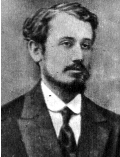
М.П. Кравчук. 1915 р.

Успішно склавши магістерські іспити у вересні 1917 року, він одержав звання приват-доцента.