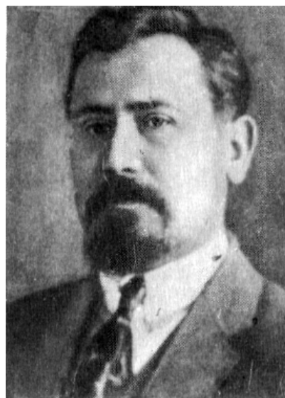
М.П. Кравчук. 1930 р.

академіка Петербурзької академії наук, засновника математичної наукової школи в Росії. Але ж Чебишева знали. І не менше, а може й більше знав увесь цивілізований світ і Михайла Кравчука як видатного українського вченого в галузі диференціальних та інтегральних рівнянь, теорії множин, теорії функцій та вищої алгебри, математичної статистики, теорії ортогональних поліномів, наближених обчислень та фахівця з історії математики та філософської думки. Про його визнання як великого вченого свідчить і те, що в 1925 році його було обрано дійсним членом НТШ у Львові, членом Німецького математичного товариства, членом Французького математичного товариства,