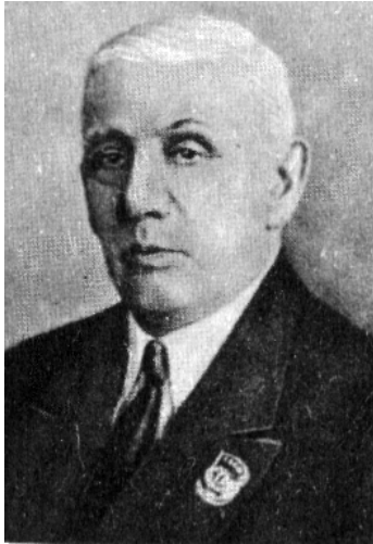
Академік Д.О. Граве