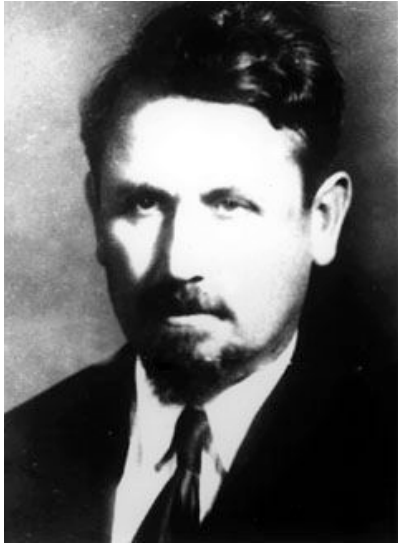
М.П. Кравчук. 1935 р.

членом математичного товариства в Палермо (Італія). Він бере участь в роботі 8-го Міжнародного математичного конгресу в Болоньї, а повертаючись з Італії, робить доповідь на засіданні Французького математичного товариства. Отже, світова слава до вченого прийшла.