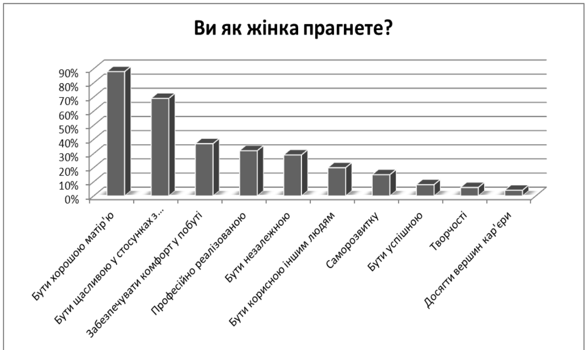
Рис.1. Прагнення опитуваних з позиції ідентичності «Я – жінка»

Співставлення даних, отриманих в результаті дослідження прагнень опитуваних з позиції гендерної ідентичності і показників рангування життєвих цінностей-цілей та цінностей-засобів дають змогу зробити наступні висновки: