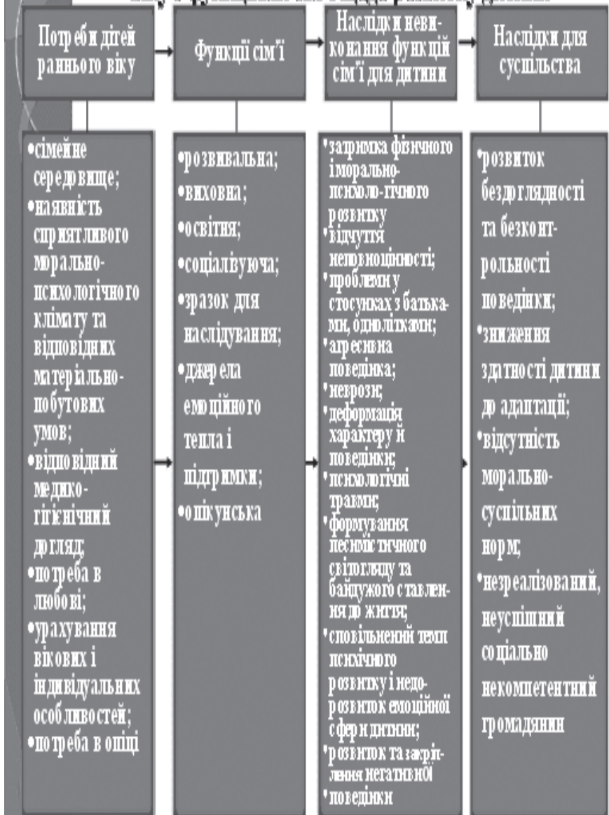
Рис. 1. Взаємозв'язок реалізації основних потреб дітей раннього віку з функціями сім'ї щодо розвитку дитини