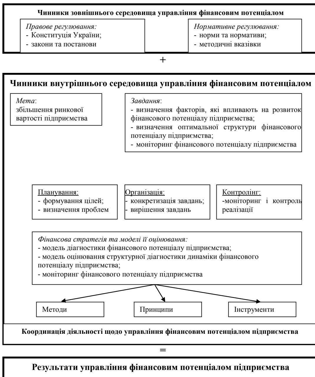
Рис. 2. Візуалізація механізму координації управління фінансовим потенціалом підприємства