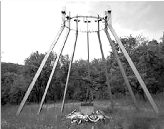
Пам'ятник жертвам більшовицького терору, похованим в шахтах Саліні

Якби кожен прагнув почути пісню птаха, що не вмирає.