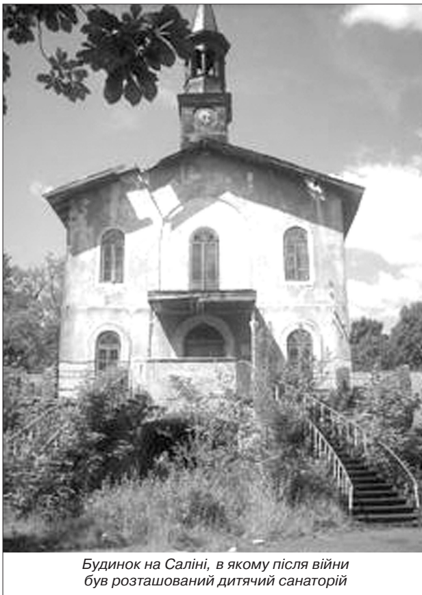
Будинок на Саліні, в якому після війни був розташований дитячий санаторій

Будьмо з Богом! Жиймо за Його законами! – аж кричить до серця кожного з нас оповідання "Відповідь неба". Радянська влада залишила