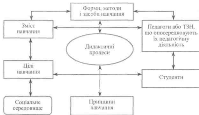
Рис. 1. Структура педагогічної системи у вищому навчальному закладі

Наприклад, широкий розвиток підприємництва і бізнесу в ХХ ст. потребував від систем освіти підготовки висококваліфікованих менеджерів, що здатні працювати самостійно, активно і творчо. При цьому соціальне замовлення торкнулося не лише змін цілей і змісту навчання, а й інших елементів: удосконалення форм і методів навчання, підвищення рівня кваліфікації педагогічного персоналу тощо.