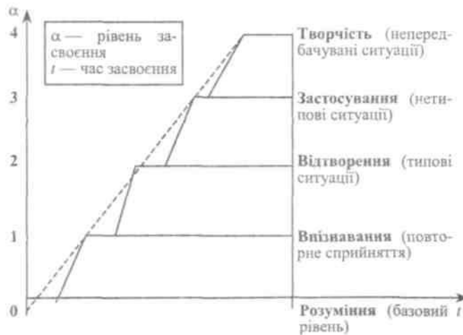
Рис.1 - Рівні засвоєння навчальної інформації за В. П. Беспалько:

5) принципи навчання (зазнають розвитку від перших курсів до старших у зв'язку з ускладненням об'єкта управління);