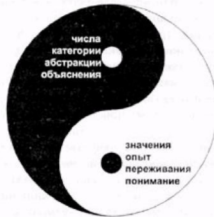
Рис. 1. Соотношение областей применения качественного и количественного методов в социологии.

Этот рисунок отражает взаимосочетаемость двух методов на разных иерархических уровнях исследования. Качественный играет решающую роль на более низком, эмпирическом, уровне исследования: там, где мы имеем дело с изучением конкретного опыта, переживаний реальных людей, там, где необходимо понимание. В то же время на более высоком уровне агрегированности данных количественная стратегия оказывается более информативной. При этом каждый вид дополняет друг друга: «значения» не должны игнорироваться, когда мы переходим к более высокому уровню абстрагирования, и количественные показатели, «числа», в качестве фона должны учитываться при выявлении «значений». Следовательно, данные методы могут мирно сосуществовать в практике социологических исследований.