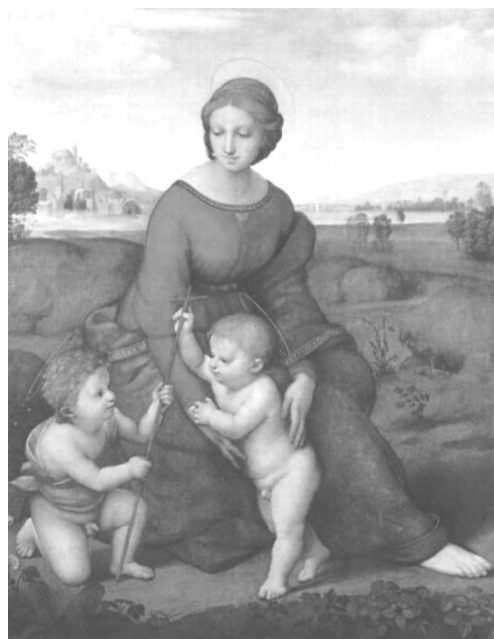
Рис. 6. "Мадонна з Немовлям і Іоанном Хрестителем", Рафаель (1506 р.)