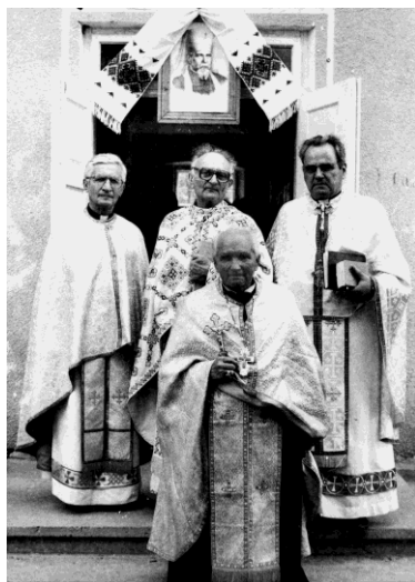
У Зарваниці. Вшанування пам'яті Патріярха Йосифа Сліпого, 19-21.05.1995 р.