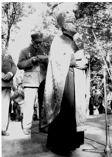
Під час святкування 52 річчя УПА, 15.10.1994 р., м. Івано-Франківськ