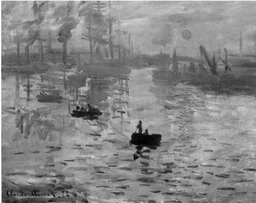
Рис. 12. "Враження. Схід сонця". Клод Моне, 1872 р.

26. Перегляньте картину французького художника Клода Моне 19 . За якими ознаками можна визначити її належність до нового на той час художнього стилю – імпресіонізму?