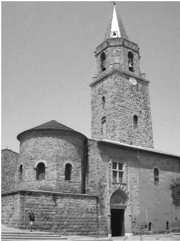
Рис. 1. Баптістерій (приміщення для здійснення хрещень) Собору Святого Леона у Фрейжюсі. V ст. Франція