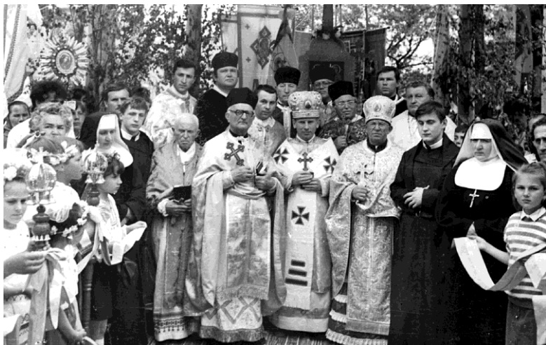
На посвяченні могили. Перегінськ, липень 1990 р.