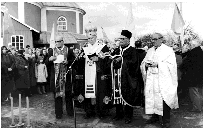
На стрілецьких могилах. с. Кути