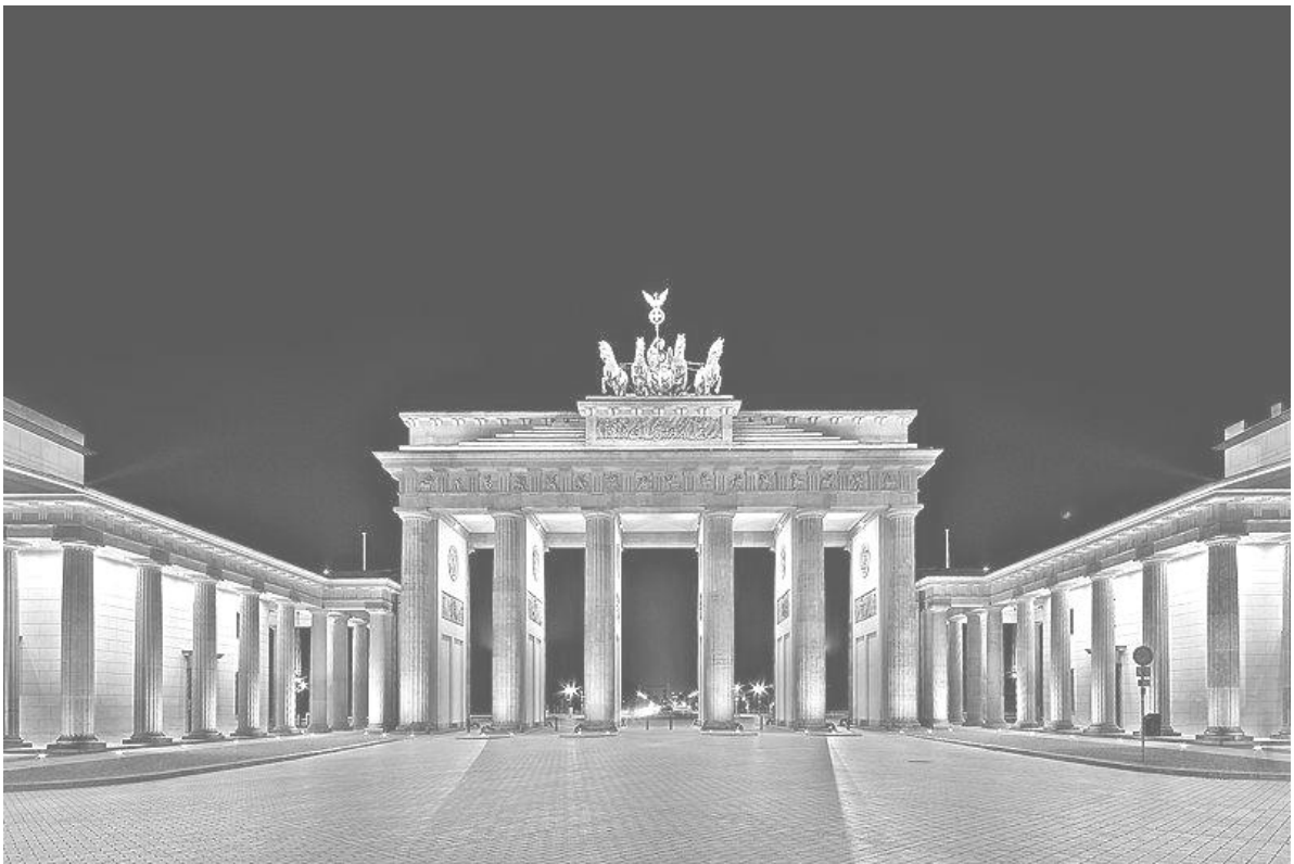
Рис. 11. Бранденбурзькі ворота (1789 – 1791). Берлін, Німеччина