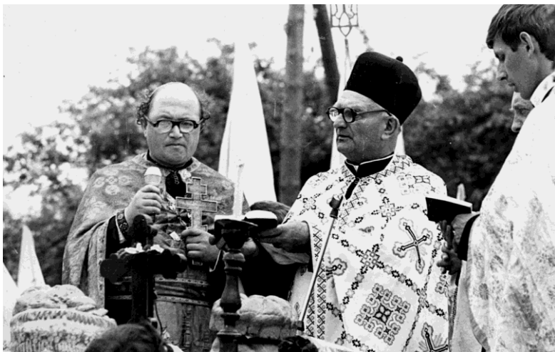
На святі в с. Горохолино Богородчанського р-ну, 1991 р.