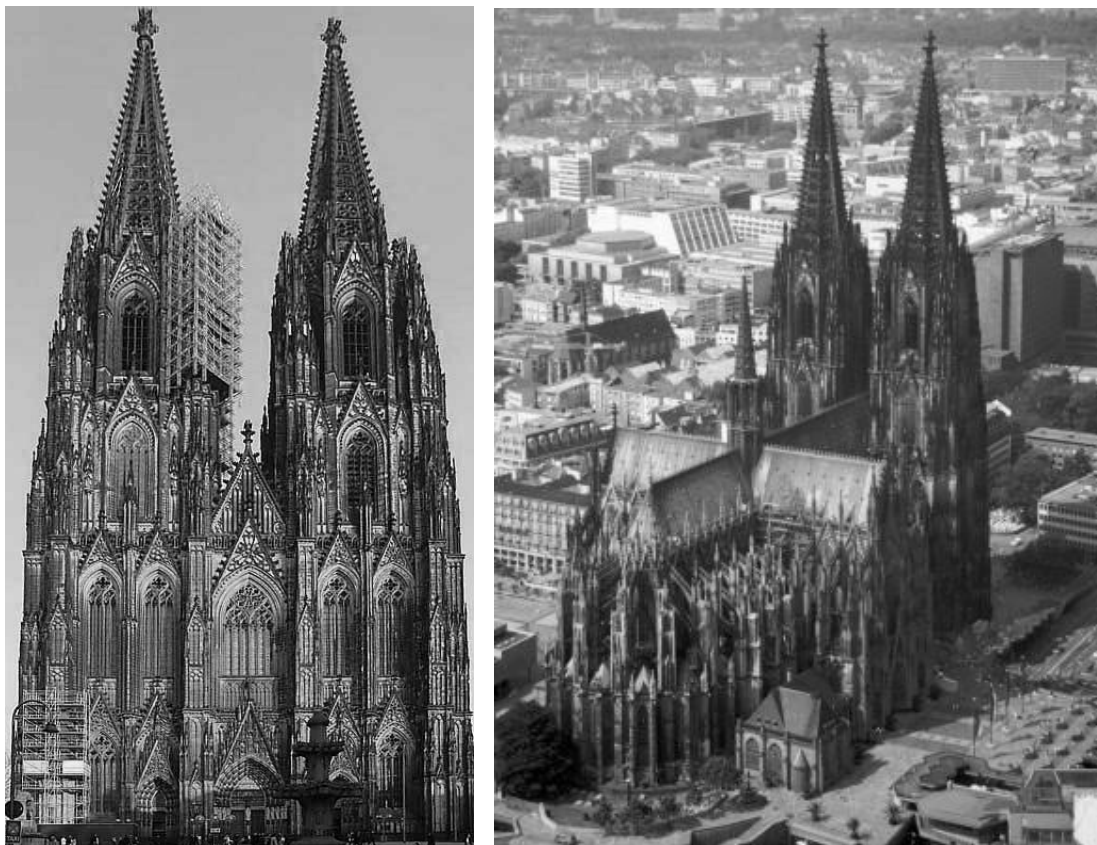
Рис. 4. Кьольнський Собор. 1248 – 1322 рр. (завершений у 1842 – 1880 рр.). Кьольн, Німеччина

18. Прочитайте наведений уривок з праці Джованні Піко Дела Мірандоли 13 .