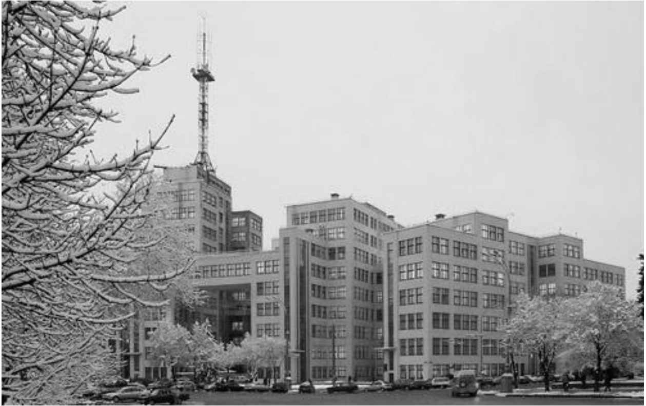
Рис. 14. Держпром (1926 – 1928 рр.). Харків, Україна