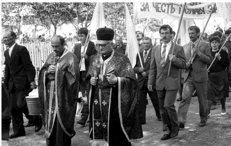
Похід до стрілецьких могил, 1992 р.