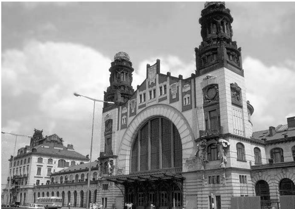
Рис. 13. Центральний вокзал. (1909 – 1912 рр.). Прага, Чехія

27. Проаналізуйте наведені будівлі. До яких архітектурних стилів вони належать? За якими ознаками це можна визначити?