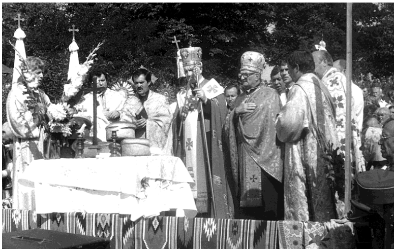
Посвячення могили, с. Росільне, 15.08.1993 р.