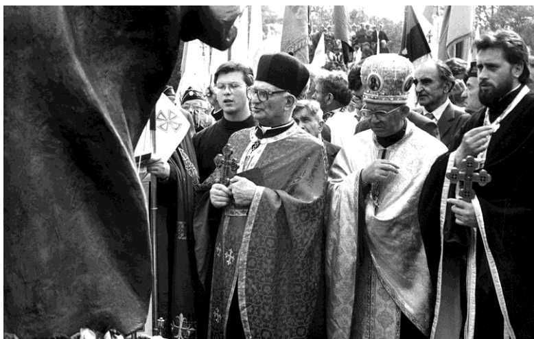
Біля пам'ятника Степана Бандери в Угринові, серпень 1992 р.