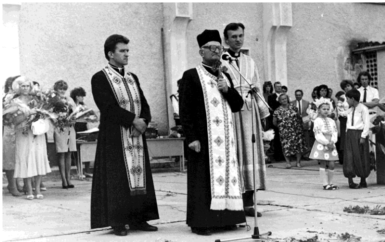
Виступ на І-му дзвонику в СШ №23 м. Івано-Франківська, 1992 р.