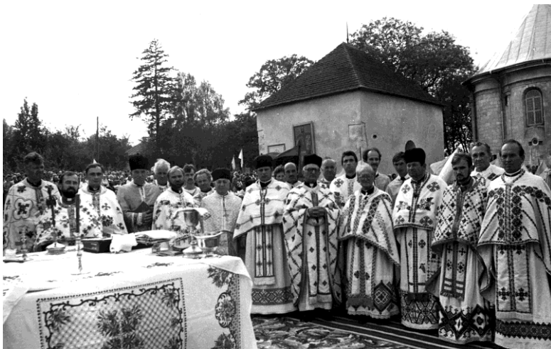
Біля джерел української духовності. Крилос, 26.06.1990 р.