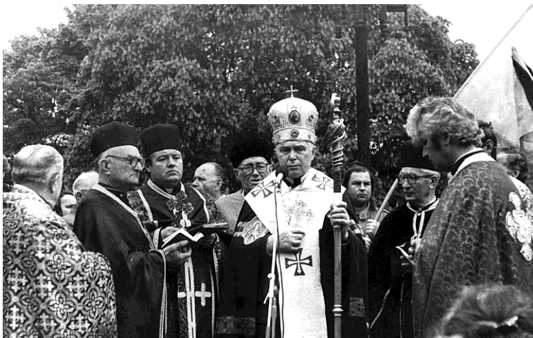
На панахиді, присвяченій жертвам Чорнобиля, 26.04.1990 р.