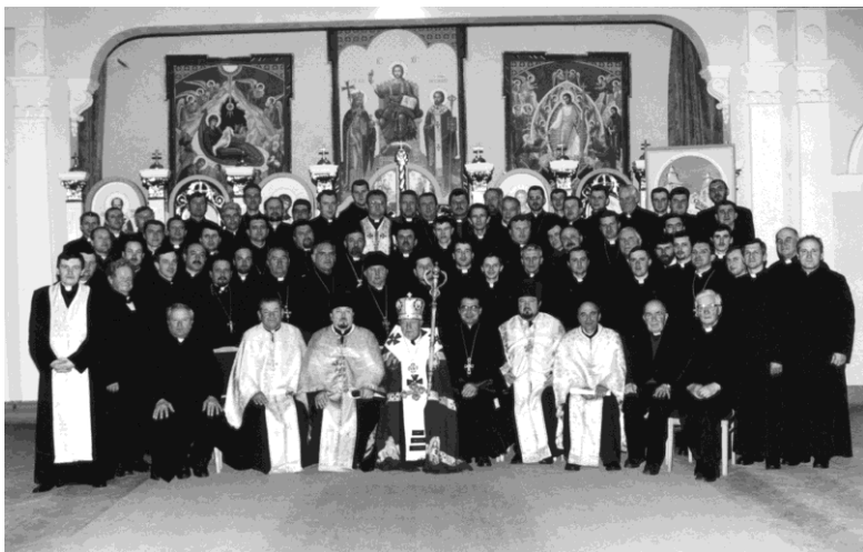
І-ий собор Отців і мирян Івано-Франківської Духовної Академії, 2002 р.