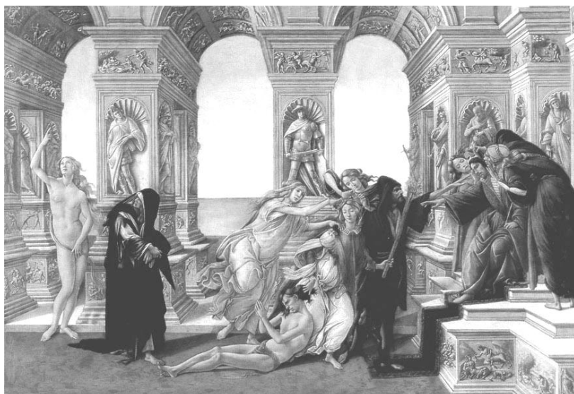
Рис. 9. "Обмова Апеллеса", Ботічеллі (1494 р.)

21. Прочитайте наведений уривок з праці М. Вебера 15 .