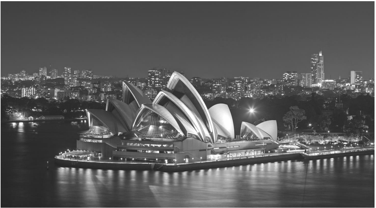
Рис. 16. Оперний театр (1961 – 1973 рр.). Сідней, Австралія