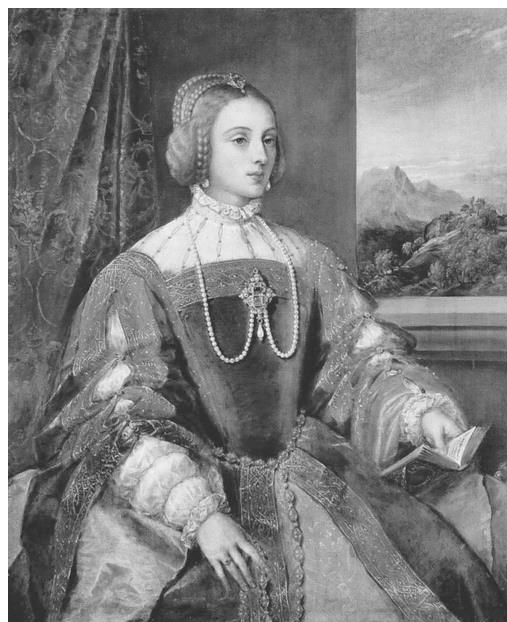
Рис. 8. "Потрет імператриці Ізабели Португальської", Тиціан (1548 р.)