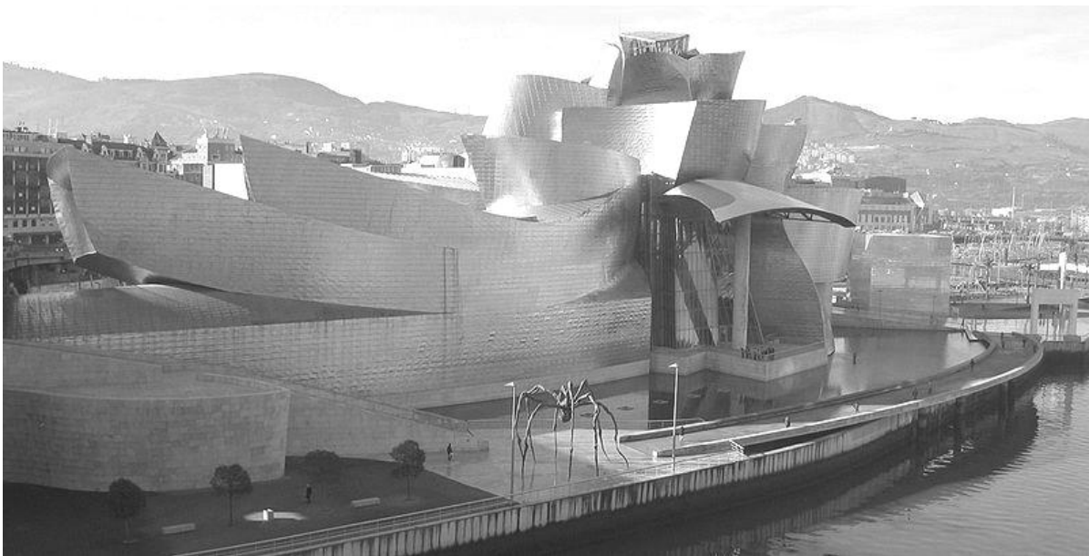
Рис. 17. Музей сучасного мистецтва Ґуґенхайма в Більбао (1997 р.) Більбао, Іспанія