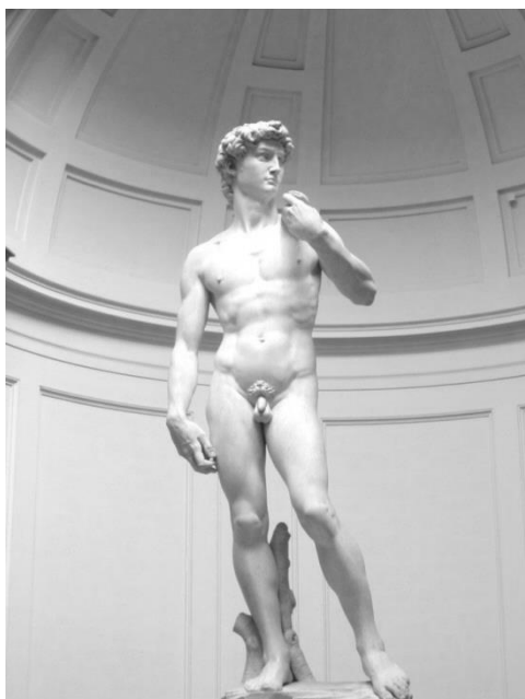
Рис. 5. "Давид", Мікеланджело (1501 – 1504 рр.)

Які специфічні риси художньої культури Відродження можна виділити в наведених картинах?