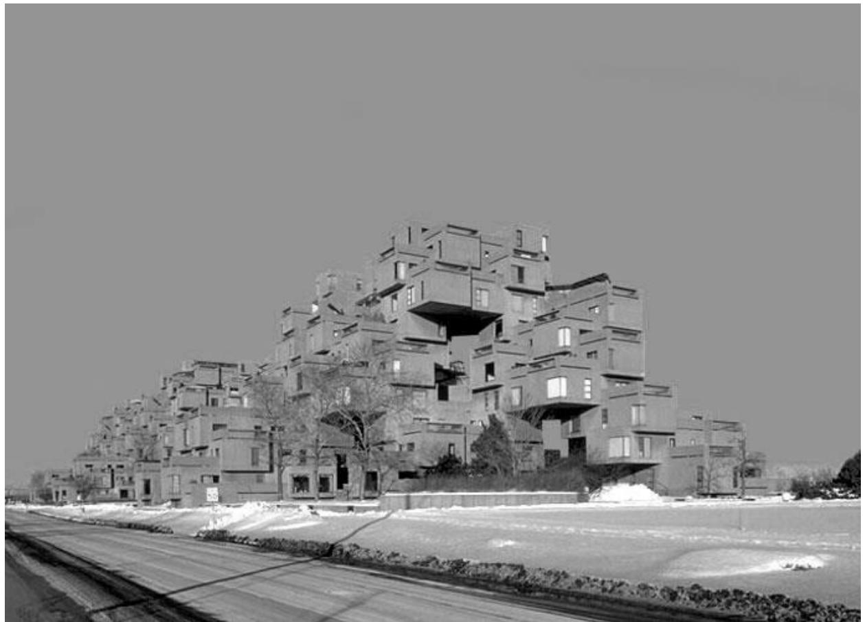
Рис. 15. Житловий будинок (1920-ті рр.). Франція