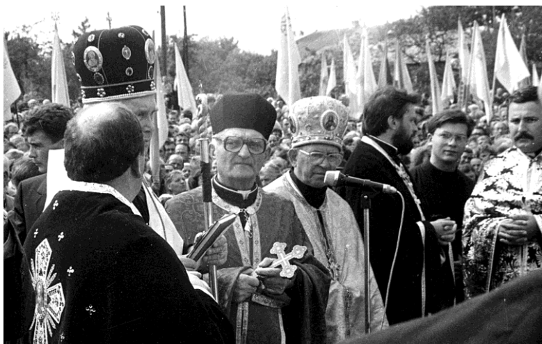
Благословення пам'ятника Степану Бандері, с. Угринів, 1992 р.