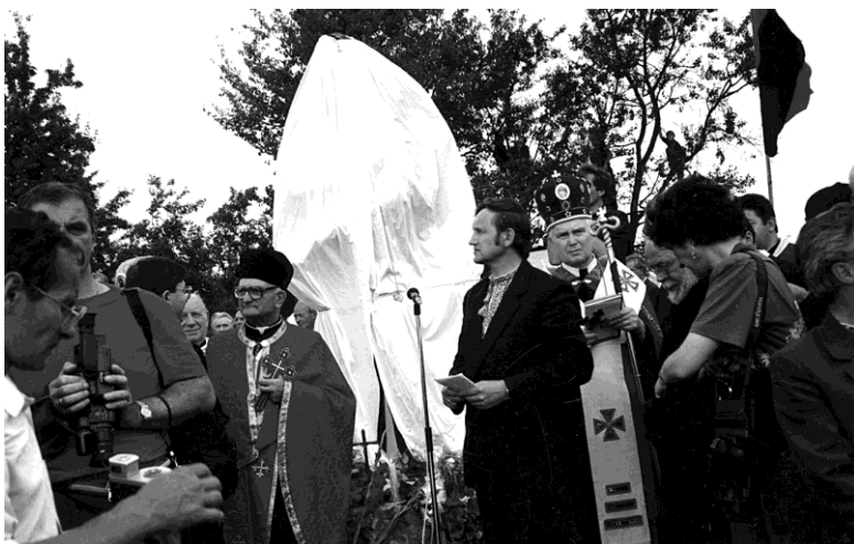
На відкритті пам'ятника Степану Бандері, с. Угринів, 1992 р.