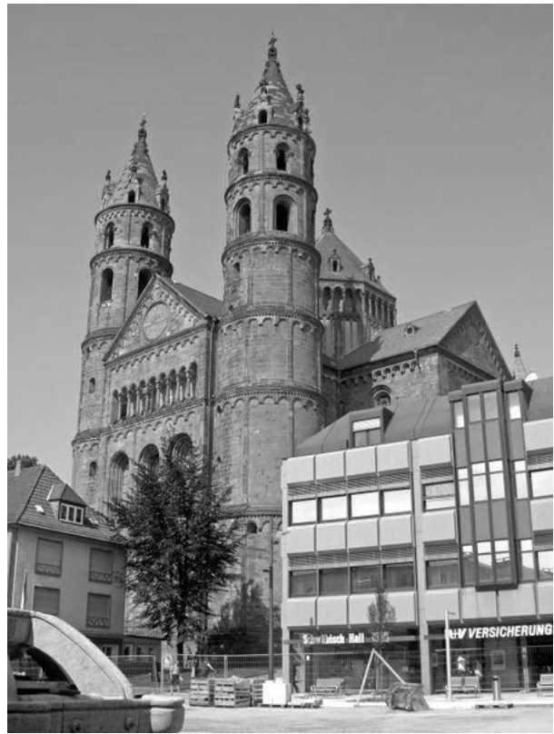
Рис. 2. Собор Святого Петра (Вормський Собор). 1181 – 1234 роки. Вормс, Німеччина