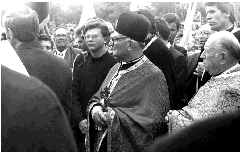
На святі в Угринові, серпень 1992 р.