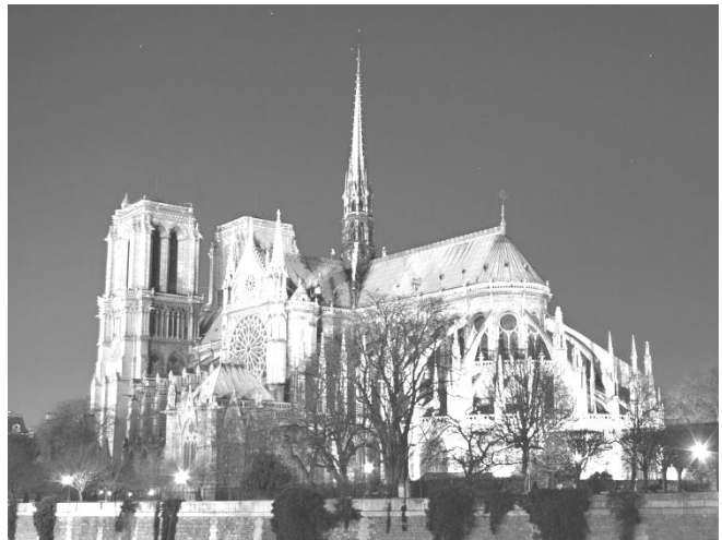
Рис. 3. Собор Паризької Богоматері. XII – поч.XIV ст. Париж, Франція