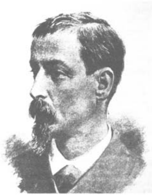
Рис. 47. Генрик Сенкевич.

Повісті Г. Сенкевича викликали гостру критику з боку тогочасних польських літераторів, які закидали авторові створення такого образу минулого, що навчав не тверезому розрахунку, а бездумному ентузіазму. Критично оцінили повісті Г. Сенкевича українські письменники і вчені (І. Франко, М. Грушевський та ін.), які звинуватили