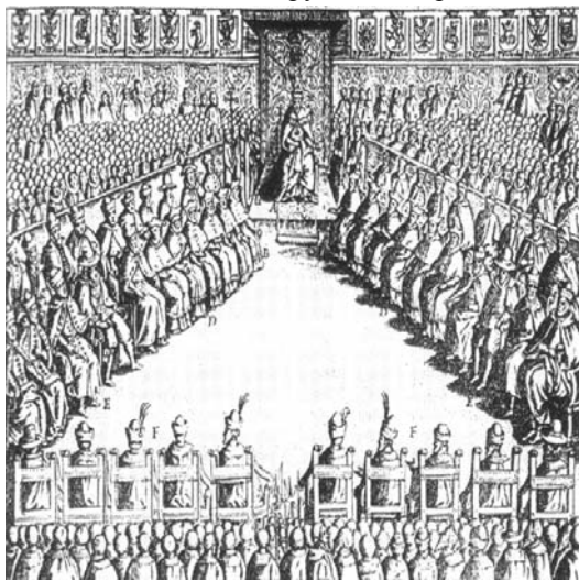
Рис. 13. Польський сейм часу Сигізмунда III. Літографія Якуба Лауро 1622 р.

У державному устрої Речі Посполитої немаловажну роль відігравали сеймики , що скликалися у воєводствах і були одним з яскравих проявів шляхетського самоврядування. За питаннями, які вони вирішували, сеймики поділялися на кілька видів. Передсеймові сеймики збиралися за королівськими універсалами, а коли йшлося про сеймики стосовно сеймів конвокаційних, елекційних та коронаційних, то за універсалами примаса-інтеррекса. Вони обирали послів на сейм. Послам вручалися ухвалені цими сеймиками інструкції з переліком питань, вирішення яких вони повинні були