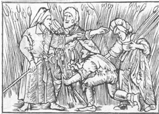
Рис.11. Панщина. Гравюра XVI ст.

Розширення посівних площ фільварків автоматично тягло за собою посилення експлуатації селян . Найвідчутнішим для них було зростання норм панщини: вона доходила до чотирьох-шести днів з лану на тиждень. У першій половині XVII ст. ланових селянських господарств було порівняно небагато, типовими були півланові і чвертьланові. Їхня норма панщини була відносно вища, ніж у “лановиків”: для півланового господарства – 3-4 дні, для чвертьланового – 2-3 дні. Відбираючи у селян значну частину робочого часу і сил, панщина й різні відробітки, до яких їх примушувало, призводило до того, що селяни не мали змоги приділяти належної уваги