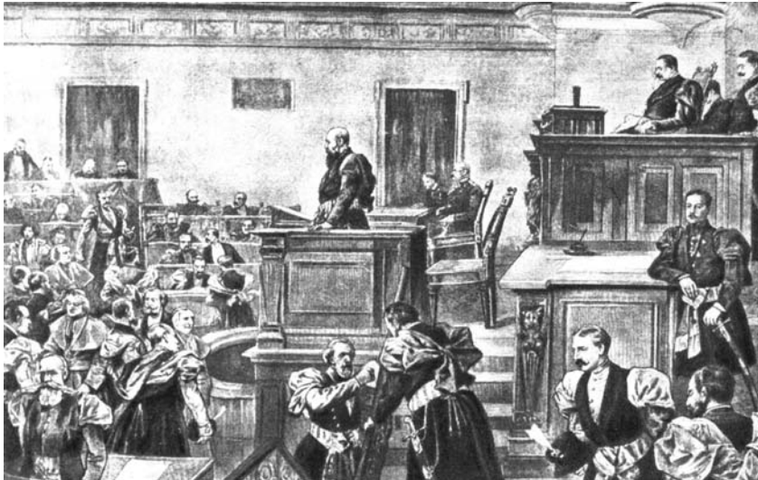
Рис.42. Засідання крайового сейму у Львові. Малюнок А.Фідлера.

Повстання 1863-1864 рр. відволікло увагу польських патріотичних кіл від проблем Галичини і скерувало їхні зусилля на допомогу повстанцям. У відповідь австрійський уряд оголосив тут стан облоги, вдався до арешту активних польських патріотів. Між тим проти централістської політики уряду німецьких лібералів виступила угорська шляхта, вимагаючи подальших кроків на шляху федеративної перебудови монархії. Після поразки австрійської армії від прусаків у битві під Садовою 1866 р. імператор Франц Йосиф був змушений піти на поступки угорцям. Відчуваючи слабкість монархії, польські шляхетські кола після тривалої дискусії в грудні 1866 р. схвалили адрес (петицію) до імператора (84 голоси “за” і 40 “проти”), в якій готові були зайняти лояльні позиції по відношенню до монархії за умови її перебудови на федеративних засадах і надання полякам повної автономії в Галичині. Адрес закінчувався відомими словами: “Без страху відступити від нашої національної думки, з вірою у покликання Австрії і рішучість змін (...) з глибини наших сердець свідчимо, що при тобі, найясніший пане, стоїмо і стояти хочемо”.