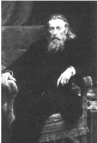
Рис.48. Ян Матейко. Автопортрет.

Суспільному значенню художньої літератури у період позитивізму дорівнював лише живопис . Цей факт пояснювався розширенням кола споживачів мистецьких творів, котрі підкреслювали свою приналежність до національної культури. 1879 р. в Кракові було засновано Національний музей ; тут діяла Школа мистецтв . Більшість польських художників на тривалий час виїжджала до європейських осередків живопису в Парижі, Відні, Римі, Мюнхені, Петербурзі. Польські митці працювали під переважним впливом європейських художніх течій.