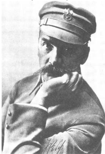
Рис.54. Юзеф Пілсудський.

Польські легіони. Східний легіон під впливом ендеків відмовився присягати австрійцям і був розформований. Західний легіон розпочав дії на австрійсько-російському фронті біля Кракова. За рік бойових дій він розрісся до трьох бригад, що налічували 25 тис. вояків. Найбільш патріотичні настрої панували в I-й бригаді, якою командував Ю. Пілсудський. У її складі було чимало творчої молоді, яка була відданою ідеї незалежної Польщі, творила легенду польських легіонів і культ Ю. Пілсудського (пісня Ми Перша бригада ). Другою бригадою керував полковник Юзеф Галлер (1873-1960), третьою – генерал Болеслав Роя (1879-1940). Бригади взяли участь у багатьох битвах першого року війни (під Ловчувком, Молотковом, Рокитною, Костюхновкою та ін.), зазнавши серйозних втрат. Ю. Пілсудський шукав