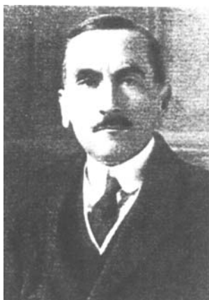
Рис. 45. Роман Дмовський.

Тим часом 1887 р. З. Мілковський з кількома однодумцями заснував у Женеві Лігу Польську , яка проголосила своєю метою відновлення незалежної Польщі в кордонах 1772 р. Цьому передувала публікація брошури З. Мілковського Справа про чинну оборону і національний скарб , в якій містився заклик до створення таємних організацій,