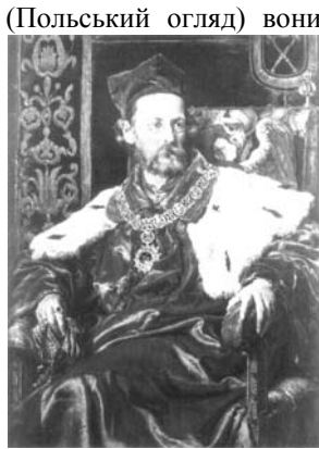
Рис.44. Юзеф Шуйський – історик, один з ідеологів краківських консерваторів. Портрет Я. Матейка.

(Польський огляд) вони опублікували серію памфлетів під загальною назвою Тека Станьчика (Папка Блазня), в яких у формі листів, зібраних нібито Станьчиком (королівським блазнем XVI ст.), їдко висміяли змовницько-повстанську тактику боротьби, яка не принесла бажаних наслідків, а виявилася згубною для поляків. Автори звинувачували самих поляків у поділах Польщі, виводячи їх причини з браку суспільної дисципліни, відсутності сильної централізованої влади та “інстинкту управління”. Вони пропонували відмовитися від романтично-повстанських зривів, оцінювати ситуацію “зимним розумом”, шукати засобів збереження нації шляхом угоди з Габсбургами. До провідних ідеологів краківського консерватизму належали історик Юзеф Шуйський (1835-1883), граф Станіслав Тарновський (1837-1917), публіцист Станіслав Козьмян (1836-1922), граф Людвік Водзіцький (1834-1894) та ін. За назвою памфлетів краківських консерваторів називали станьчиками . Від краківських консерваторів дещо відрізнялись їхні східногалицькі однодумці, яких називали подоляками . Лідерами останніх були – Казімеж Грохольський , Войцех Дзедушицький (1848-1909); вони посідали впливові державні посади, відзначалися крайнім консерватизмом у соціальних та політичних питаннях, намагалися обмежити український національний рух, а також права євреїв у Галичині.