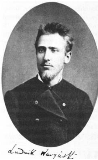
Рис. 46. Людвік Варинський.

партії “Пролетаріат”. У ній окреслювалися мета і засоби боротьби за звільнення польського робітничого класу. Підкреслювалося, що польські робітники повинні виступати проти всіх “експлуаторських класів” спільно з пролетаріатом інших європейських країн, домогтися передачі землі і засобів виробництва в руки соціалістичної держави. Для цього вони повинні були організуватися у таємні гуртки, які чинитимуть опір владі, захищатимуть права робітників, а при потребі вдаватимуться до терору проти представників влади, зрадників і провокаторів. У перспективі передбачалося встановити “самоврядування політичних груп”, запровадити свободу слова, друку, зборів, рівноправність жінок, виборність усіх чиновників тощо. Основними методами боротьби визнавалися страйки і терор. Програма не згадувала про селянство і справу незалежності Польщі.