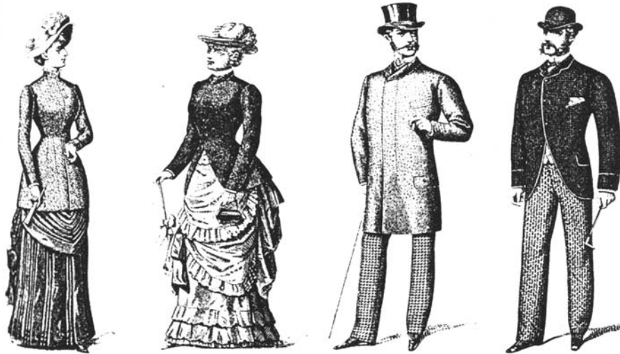
Рис.49. Картинки моди. 1884 р.

блузки, жакети за взірцем чоловічого вбрання. Незмінними залишилися корсети. Плащі були коротшими від спідниць, а капелюхи набирали форми лицарського шолому з квітками. Неодмінним елементом одягу були рукавички та шалі.