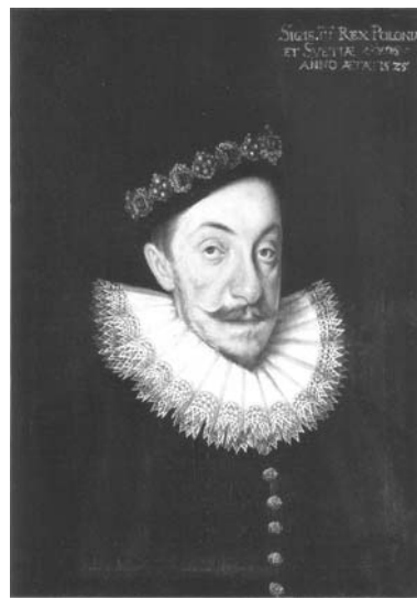
Рис. 14. Портрет Сигізмунда III. Художник Марцін Кобер, 1591 р.

Вичерпання можливостей екзекуційного руху відкрило шлях для трансформації шляхетської демократії в її різновид – режим магнатської олігархії , що остаточно склався в середині XVII ст.