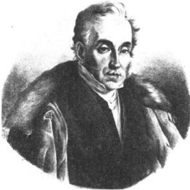
Рис.37. Князь А.С. Чарторийський. Літографія С. Олещинського.

конкретних внутрішньополітичних питань. Вони дбали насамперед про політичну єдність, тверезий аналіз ситуації, поширення християнських моральних засад і національної культури. Постійно проводилася думка, що спочатку – незалежність, а потім соціальні реформи.