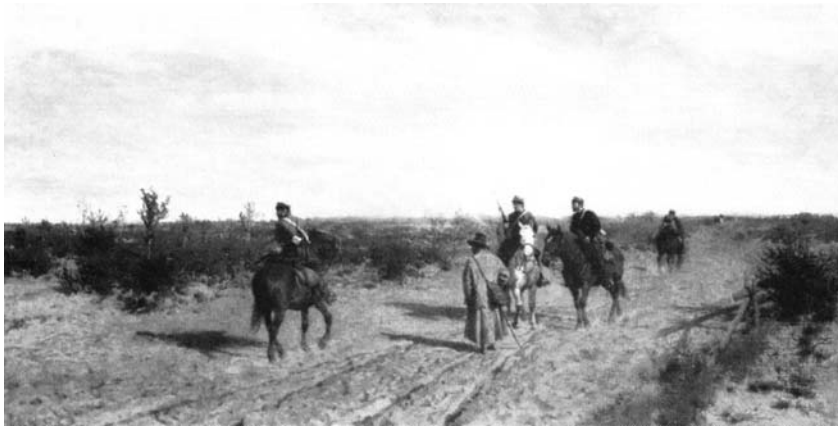
Рис.40. Повстанський патруль. Картина Максиміліана Геримського, 1873 р.

скарбовий, преси. Уряд випускав кілька підпільних видань (“Рух”, “Неподлеглосць”, “Відомості з поля битви” та ін.), збирав податки, здійснював революційне правосуддя (трибунал). “Таємна держава” функціонувала справно, населення підпорядковувалося його розпорядженням, а громадська солідарність обмежувала до мінімуму кількість ймовірних донощиків. Завдяки цьому повстання протривало понад півтора року. Коли намісник Костянтин Миколайович запитав у командувача російської армії графа Ф. Берга про результати пошуку таємного уряду повстанців, той відповів: “Я переконався лише в одному – ані я, ані Ви, Ваша світлість, до цього уряду не входимо”. У червні 1863 р. поляки, які працювали в центральній касі Королівства Польського, конфіскували і вивезли для потреб повстанців 3,6 млн рублів, котрі там знаходилися.