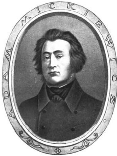
Рис.39. Адам Міцкевич. Гравюра Дантена по дагеротипу 1842 р.

Польські романтики вчинили значний вплив на формування національної філософії й суспільно-політичної думки, які розвинулися на принципах німецької класичної філософії та християнського соціалізму, поєднуючи політичні, соціальні, моральні та релігійні елементи в одне ціле. Уже наприкінці 1832 р. А. Міцкевич видав у Парижі