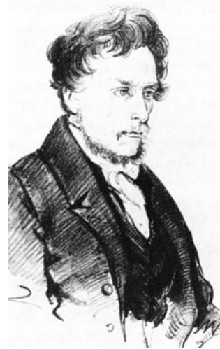
Рис.38. Йоахим Лелевель. Літографія 1832 р.

Від середини 30-х років XIX ст. найбільші впливи в еміграції здобуло Польське демократичне товариство. На той час з нього відійшла група радикалів на чолі з Т. Кремпівським; були розроблені ідейні й політичні засади організації. У грудні 1836 р. керівники ПДТ після тривалих дискусій опублікували програмний документ, який увійшов в історію під назвою Великий Маніфест . Автором його проекту був Віктор Гельтман (1796-1874). У Маніфесті робився наголос на рівності та однакових правах усіх людей, демократичних засадах суспільного устрою, з яким пов'язувалося майбутнє відродженої республіканської Польщі. Силою, що відбудує Польщу, вважався народ, основну масу якого складало селянство. Передбачався безумовний перехід у власність селян оброблюваної ними землі, надання їм повних політичних прав. Такий крок, на думку укладачів, повинен був піднести селян на боротьбу за вільну Польщу. Ставилося завдання піднести одночасне повстання на всіх землях колишньої Речі Посполитої (включно з Литвою, Білоруссю й Україною), яке повинні підготувати та очолити емісари ПДТ. Товариство оголошувало готовність співпрацювати з усіма демократичними рухами Європи, але у здобутті незалежності батьківщини покладалося лише на власні сили. “Для відновлення незалежного буття, –