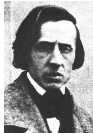
Рис.41. Єдина відома світлина Фридерика Шопена, 1849 р.

Вияткове значення для поляків і світової культури мала музична творчість Фридерика Шопена (1810-1849), який найбільше причинився до розширення жанрових можливостей музичного мистецтва в цілому, збагачення його польським фольклорним матеріалом. У Польщі творчість Шопена сприймали усі верстви – від селян до аристократів, вона мала величезний вплив на формування національної свідомості. Музичні здібності Фридерика виявились дуже рано: у семирічному віці він написав свій перший самостійний твір – полонез. Під час