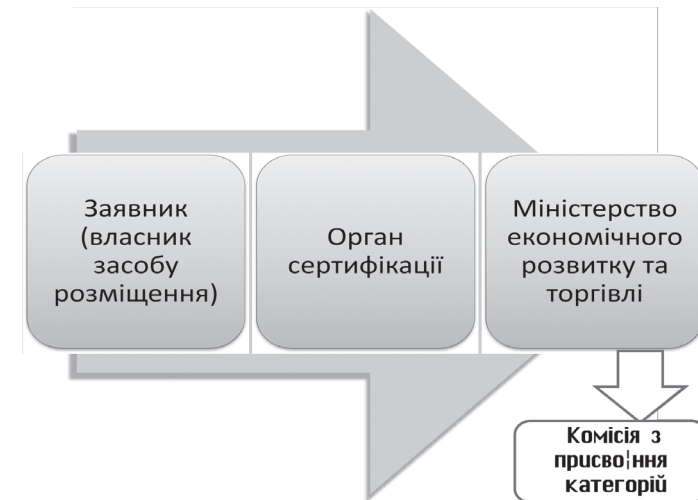
Рис. 1.34. Організаційна схема процесу отримання категорії в Україні. Розроблено автором

Заявник забезпечує відповідність засобу розміщення вимогам заявленої категорії та звертається із заявою про необхідність проведення робіт із сертифікації та оцінювання відповідності