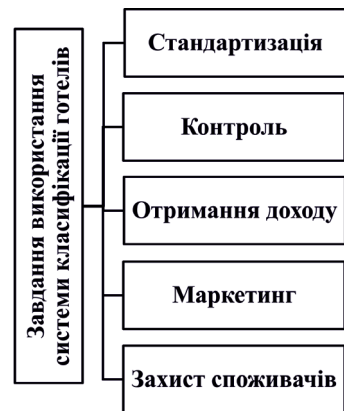
Рис. 1.32. Стратегічні завдання використання систем класифікації засобів розміщення. Розроблено автором

циплінує виконавців готельних послуг і одночасно є захисним механізмом від надмірних вимог клієнтів; процес оцінки допомагає керівникам засобів розміщення виявити і усунути недоліки в організації надання послуг та ін.