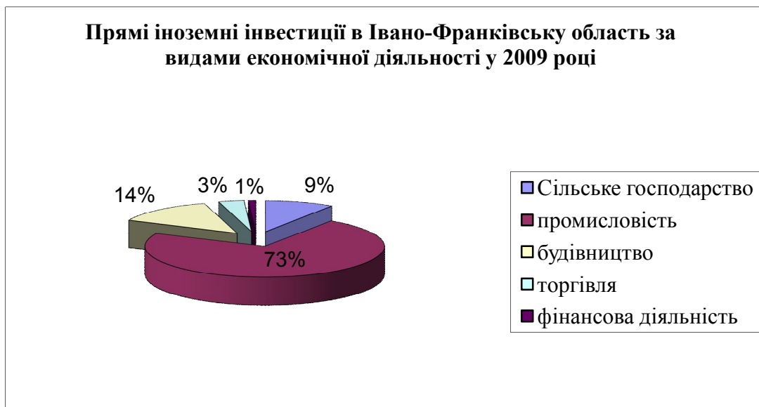
Рис. 1. Прямі іноземні інвестиції в Івано-Франківську область за видами економічної діяльності у 2009 році

Результати. Однією з характерних особливостей торгівлі як галузі економіки є висока швидкість обороту капіталу. З одного боку, це дозволяє мінімізувати інфляційні втрати в нестабільних умовах кризового періоду. Але з іншого боку, можлива втрата деякої величини доданої вартості, викликана зниженням загальної рентабельності товарообігу. Проаналізована динаміка кредиторської заборгованості за видами економічної діяльності в Івано-Франківській області протягом 2007–2009 років, де торгівля займала перше місце [1]. Відповідно до індексів фізичного обсягу, за видами економічної діяльності торгівля займала шосте місце у 2009 році. Крім того, у торгівлі, як ні в одній з галузей економіки, велика частка надходження і вибуття наявних грошових коштів. Це, у свою чергу, дозволяє формувати неврахований наявний грошовий оборот, що є основою тіньової економіки. У 2008 році прямі іноземні інвестиції, які були вкладені в економіку Івано-Франківської області, а саме: фінансова діяльність займає 73%, вкладення в будівництво – 14%, у сільське господарство – 9% і в торгівлю – лише 3% (рис. 1).